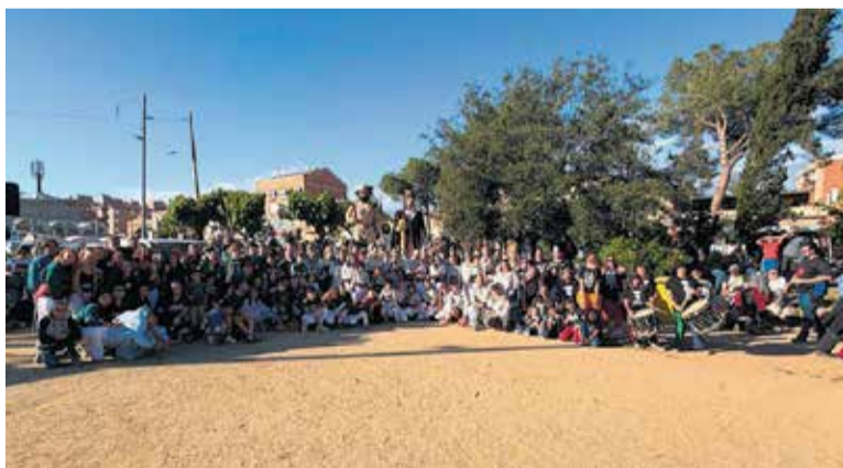
Fotografia de família de les colles culturals que van participar a la festa.

“Sense cultura no hi ha poble, i sense poble, no hi ha Festa Escaldada” , diu la colla castellera de Caldes de Montbui, després del gran èxit de participació de la Festa Escaldada, el dissabte 16 de maig: “Tanquem aquesta edició amb el cor ple i aquella sensació que encara necessitem dies per pair tot el que hem viscut” , continuen. I és que la segona