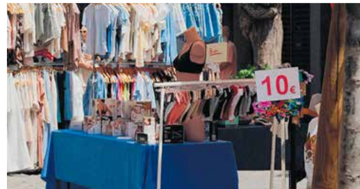
La 23a FiraBotiga se situarà a l'avinguda Pi i Margall, de 10 a 21 h.

Diumenge 21 de juny, torna l'emblemàtica i festiva FiraBotiga de l'UCIC, coincidint amb l'arrencada de la temporada d'estiu. En la 23a edició de la fira a cel obert, unes 25 parades de comerços adherits se situaran a l'avinguda Pi i Margall, durant tot el dia (de les 10 a les 21 hores), en l'exaltació del comerç de proximitat i els productes d'ocasió. Com és habitual, la jornada comptarà amb tallers adreçats als infants i famílies, amb els tiquets disponibles uns dies abans, a partir de la compra a comerços del Centre Caldes Comercial.