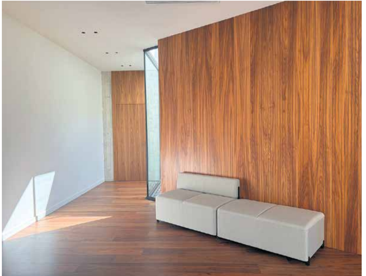
El nou tanatori, al centre urbà, ha estat un projecte cabdal en els deu anys de servei funerari de la Fundació.