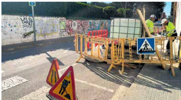
Operaris treballant en la resolució d'incidències a la via pública.

Els treballs, que tindran una durada de quatre mesos, donen resposta a l'alta demanda de registres introduïts al portal d'incidències de la via pública