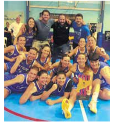
L'equip femení CN Caldes > FCBQ

Les jugadores de Segona Catalana del Club Natació Caldes s'han proclamat campiones de lliga, setmanes després d'aconseguir l'ascens a Primera Catalana.