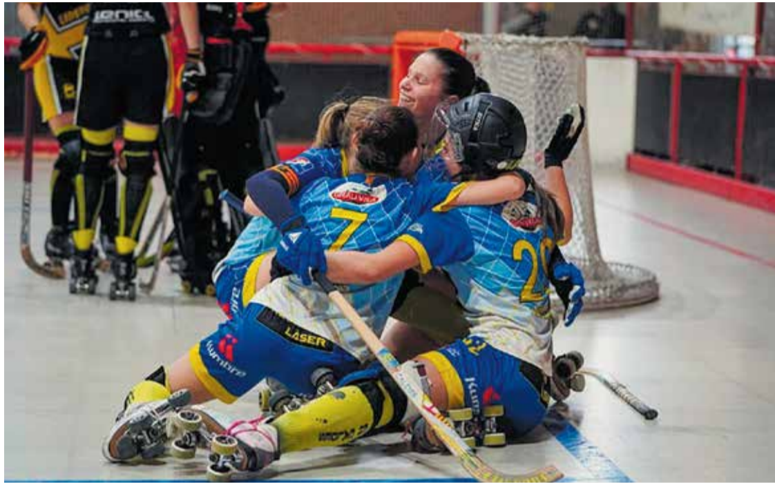
Les noies del CH Caldes celebrant una temporada històrica, disputant els play-off d'ascens. > CH CALDES

Els equips de base sempre són dels més temuts arreu de Catalunya i el club és un dels que més aconsegueix classificar per a fases finals. La Nacional Catalana és el reflex d'aquesta aposta i pel curs 2025-26, els dos equips militants en aquesta categoria estan disputant la promoció d'ascens. Tot i no ser els màxims favorits, els de Candami han superat aquest cap de setmana al CP Mollerussa, campió de lliga, i disputaran la final per l'ascens a Ok Plata enfront del Noia Freixenet. Els arlequinats van fer servir el seu savoir faire per imposar-se en els dos partits de la sèrie, amb un 0-2 a Mollerussa i un 4-1 a la Torre Roja. Ara, el Noia, que va eliminar a l'HC Castellar per 2-0, serà el rival a superar per accedir a la plaça en joc a Plata. Una plaça, però, que en cas de guanyar-la estarà pendent del primer equip. Tot i haver assolit el descens esportiu de l'Ok Lliga, l'opció de comprar la plaça