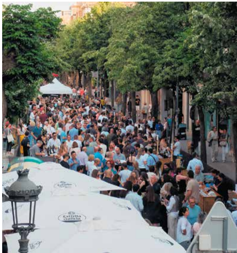
L'alta participació va omplir l'avinguda Pi i Margall, dissabte 23 de maig.