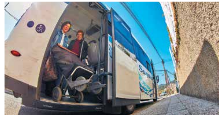
El grup posa l'accent en facilitar la mobilitat a diversos col·lectius.

L'Associació de Veïns de Can Mapsons, Els Lledoners i Can Regassol demana al consistori obrir un estudi tècnic per incorporar les tres zones extrarurbanes al sistema de transport urbà municipal. En concret, l'associació veïnal proposa crear una taula de treball amb l'equip de govern, serveis tècnics municipals i l'empresa de transport operadora "per estudiar alternatives viables: sigui una línia conjunta per a les tres urbanitzacions, una reordenació de les línies actuals o un servei pilot en les franges de més demanda" , apunta el grup ciutadà.