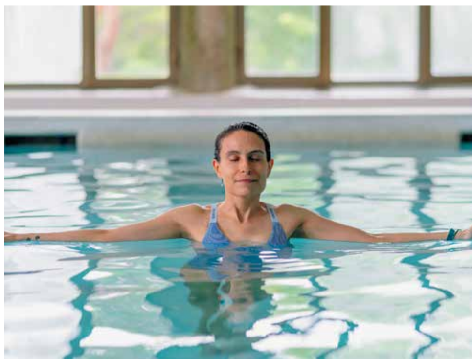
Thermalia acollirà l'exposició fotogràfica sobre l'estudi fins al setembre.