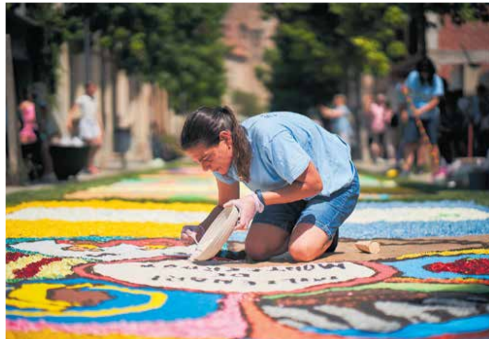
Diumenge s'exposaran les catifes florals al carrer de Font i Boet i al centre històric. > J.SERRA