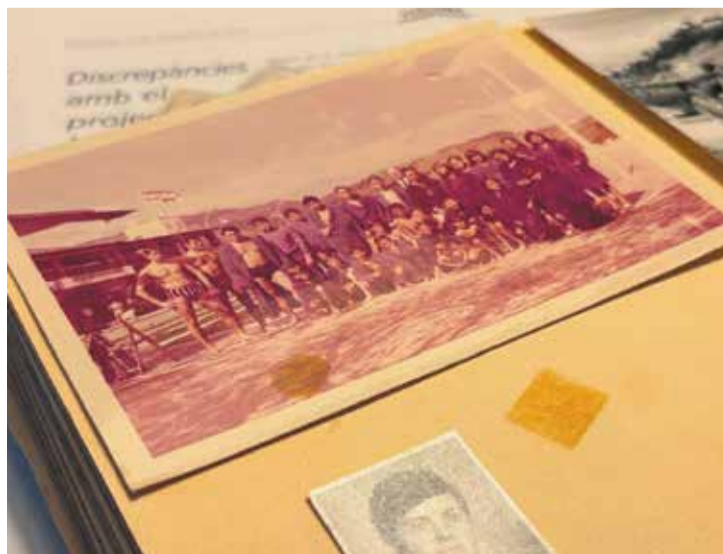
Imatge de l'equip de nedadors del CN Caldes a la dècada dels 60. > I. HIJANO

Filla d'un dels fundadors i sòcia més antiga del CN Caldes.