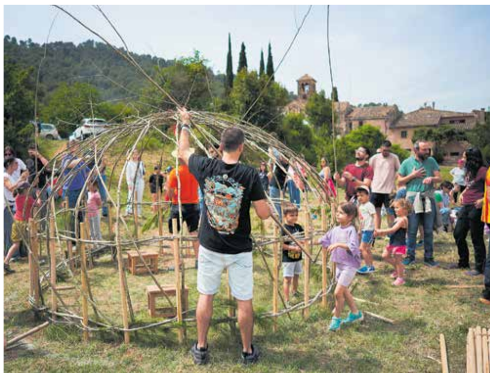
La tradició se suma a noves activitats que fan créixer la participació de grans i petits. > Q.PASCUAL