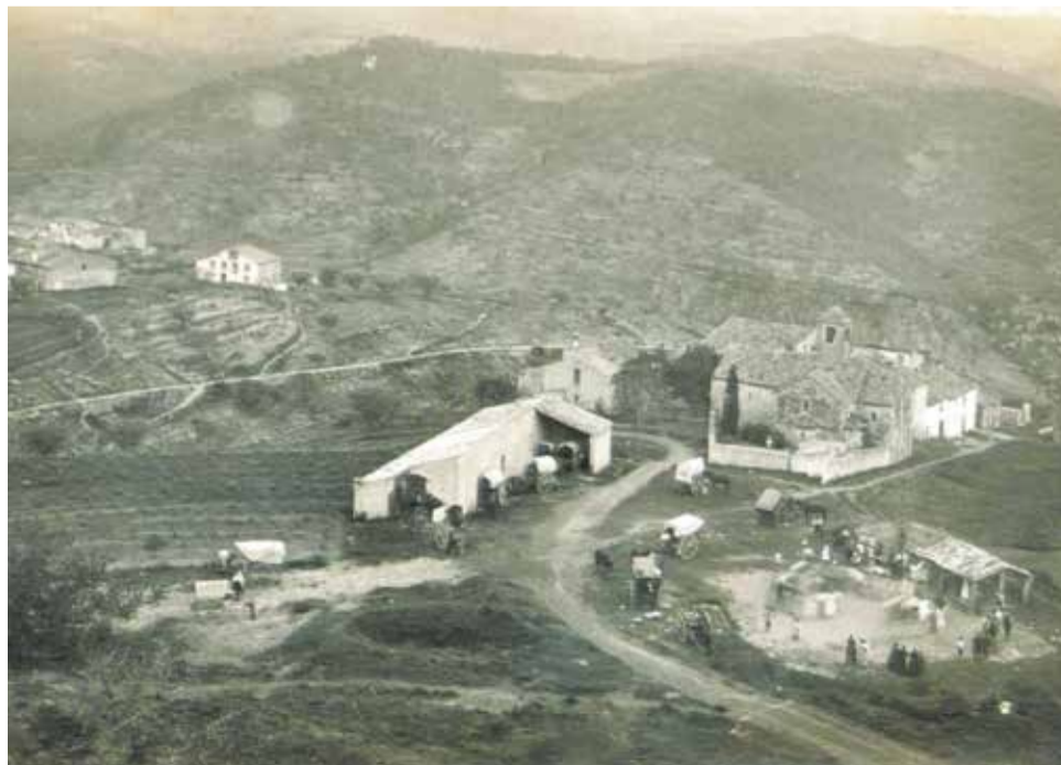
Sant Sebastià de Montmajor dels anys 20 del segle XX.