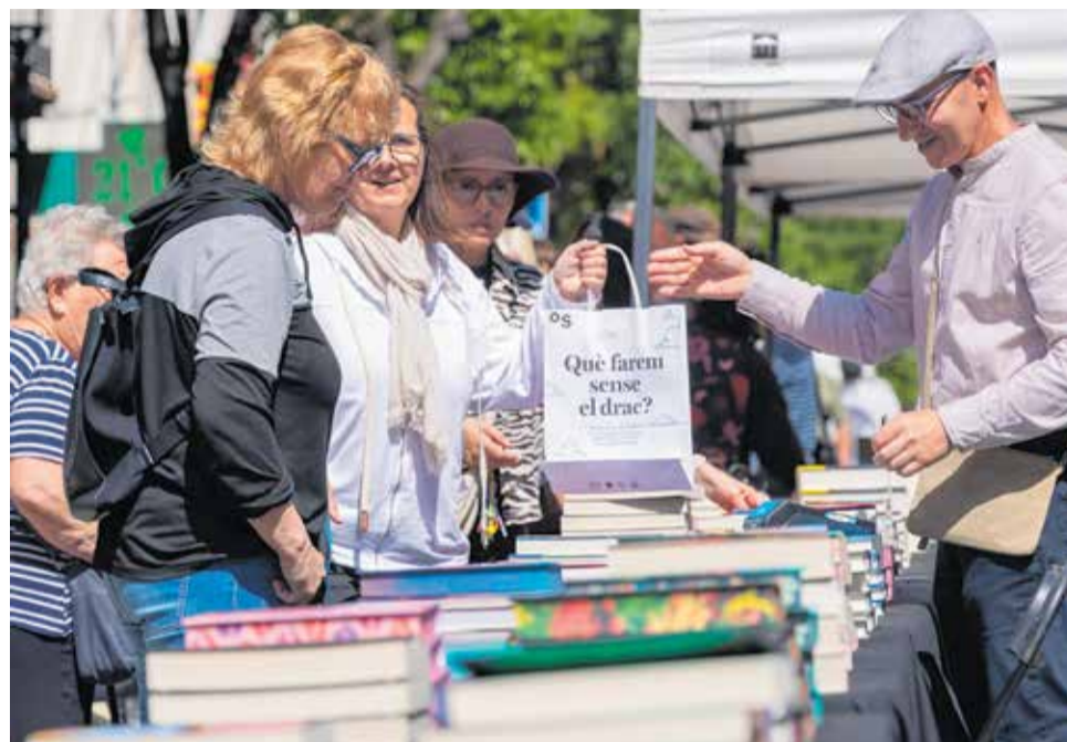
Sant Jordi, el dia de l'any més assenyalat i esperat per a les llibreries i pels autors i autores. Les parades de llibres van concentrar l'atenció dels vianants, encuriats entre l'àmplia varietat de possibilitats.