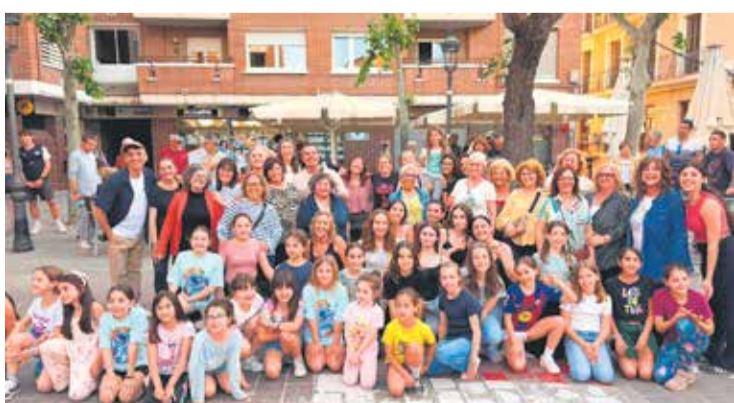
El grup d'alumnes i famílies després de l'actuació, a la pl. de l'Àngel.