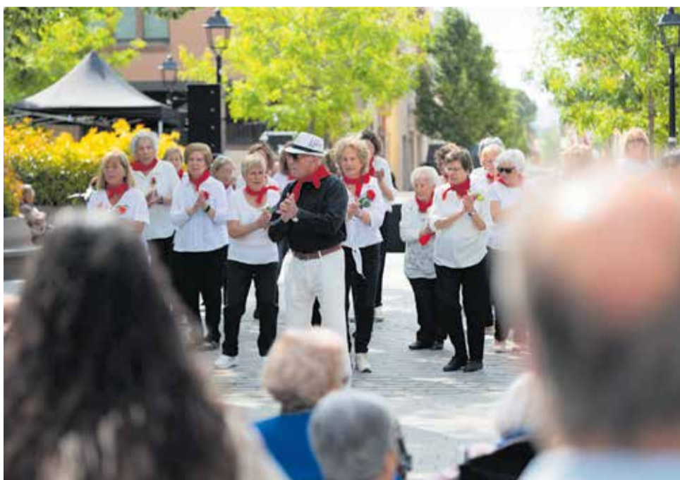
La plaça Catalunya, epicentre de les activitats i les mostres de cultura popular durant la diada de Sant Jordi. Hi van ser presents centenars de persones a través de desenes d'entitats, agrupacions i escoles.