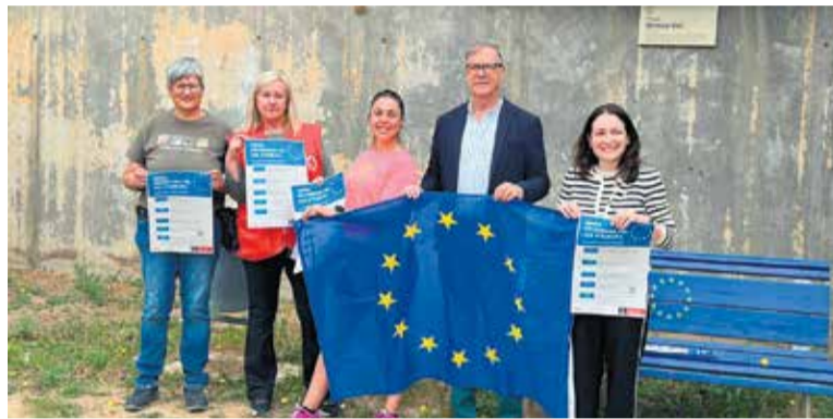
Representants de l'organització del programa, a la pl. Simone Veil.

Aquest dissabte 9 de maig se celebra el Dia d'Europa, una jornada que recorda la Declaració de Schuman, presentada l'any 1950 pel ministre francès d'Assumptes Interiors, Robert Schuman, que va suposar l'inici de la creació del que coneixem avui com a Unió Europea. Per recordar aquesta data, l'Ajuntament il·luminarà la façana del consistori els dies 8, 9 i 10 de maig, en una acció que serà conjunta amb altres institucions d'arreu del territori europeu. D'altra banda, i amb motiu de la commemoració, Caldes també presenta un programa d'activitats que l'Ajuntament ha treballat conjuntament amb l'Associació Amics d'Europa i l'entitat Creu Roja. La primera de les activitats va començar divendres passat, 1 de maig, amb el repte de sumar 514 quilòmetres –que és la distància que separen les viles agermanades Caldes de Montbui i el poble francès de Saint-Paul-lès-Dax–, entre l'1 i el 10 de maig. El recorregut comença a la plaça de la Font del Lleó fins a la Torre Roja. En paral·lel, l'acte central tindrà lloc aquest divendres 8 de maig, amb la