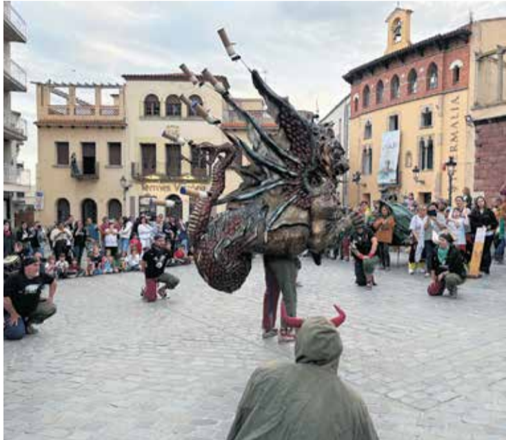
El lluïment de la Godra, a la plaça central, la tarda del 25 d'abril.

Dissabte 25 d'abril, la plaça de la Font del Lleó va acollir la trobada anual de bèsties de foc del territori, amb una gran acollida de públic, especialment en la tabalada i la cercavila de la vesprada