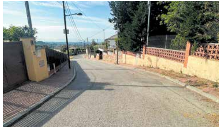
L'actuació preveu millorar la qualitat i la fiabilitat del servei. > AJ.CALDES

L'Ajuntament ha iniciat l'execució de l'obra de renovació d'una part de la xarxa d'aigua potable de la urbanització dels Saulons, una actuació que tindrà una durada aproximada de 7 mesos. Així ho va comunicar el consistori, ahir, dilluns 4 de maig, en la presentació de l'acció de millora, on es va assenyalar l'estat de degradació i envelliment de la xarxa en aquest punt, així com la seva no adaptació a les necessitats actuals per garantir un subministrament òptim, especialment en les hores punta o en situacions d'emergència.