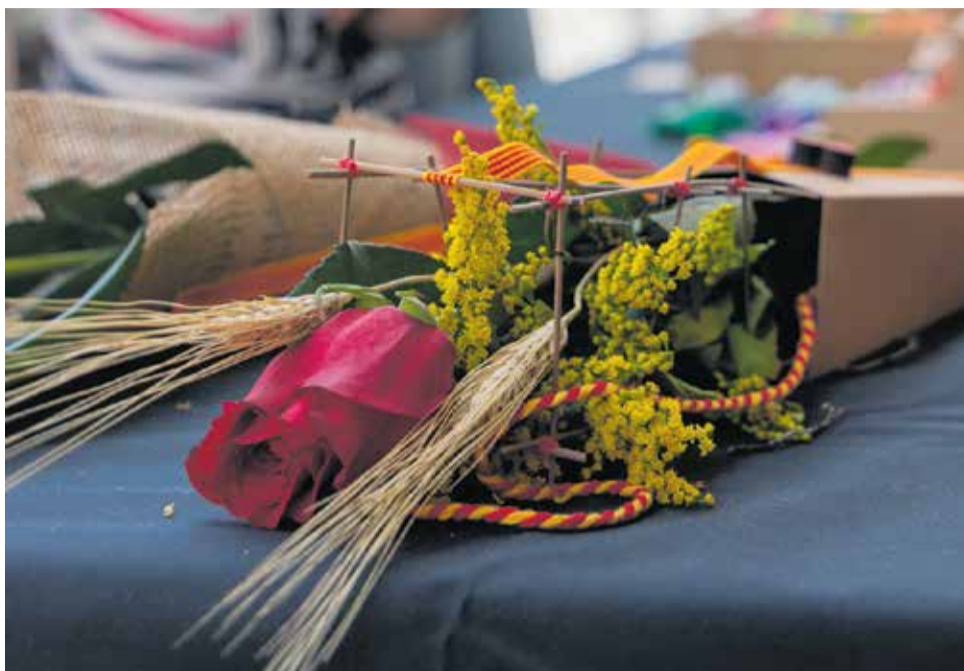
Les roses, la flor de Sant Jordi que mai passarà de moda; la mostra d'afecte i tendresa, que se sobreposa a qualsevol construcció tradicional referida, únicament, a l'amor romàntic convencional.

Ha estat una esplèndida diada de Sant Jordi, amb gran ambient de persones que han omplert els carrers i places. Roses i llibres arreu, la cultura ben viva i les emocions a flor de pell. Prop d'una cinquantena de parades, entre associacions i entitats, comerços i grups d'estudiants, van vestir l'avinguda Pi i Margall aquest 23 d'abril, un dijous excepcional. En paral·lel, l'escenari de la plaça Catalunya va acollir un programa ple d'activitats: actuacions d'escoles i entitats, actes institucionals i mostres de cultura popular. Una llúida celebració que es va estendre durant tot el cap de setmana.