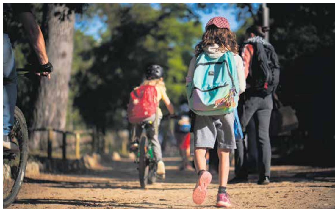
Els experts recomanen aplicar mesures per reduir el trànsit contaminant en els entorns escolars.

En aquest context, l'entitat Ecologistes en Acció ha publicat els resultats de l'estudi “La qualitat de l'aire en entorns escolars”, amb el suport de la Societat Catalana de Pediatria, on s'ha avaluat la qualitat de l'aire a partir de sensors que determinen el