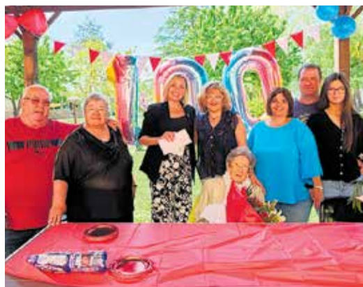
La Montserrat, amb la família i la regidora.

respecte a l'operatiu anterior, una reducció que el Cap de la Policia Local atribueix a la feina de prevenció i coordinació operativa dels darrers anys. Tot i la finalització oficial del dispositiu, la vigilància continua activa, mantenint l'atenció sobre la delinqüència organitzada especialitzada en robatoris a l'interior d'habitatges, i adaptarà els dispositius de prevenció a les noves tipologies delictives pròpies dels mesos de primavera i estiu.