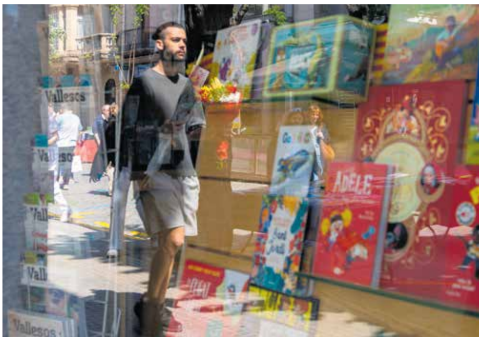
Flors i llibres arreu. La diada de Sant Jordi és sinònim de cultura en català; el mirall que reflecteix, més enllà del territori, el bon estat de salut d'una tradició llegendària i profundament identitària.