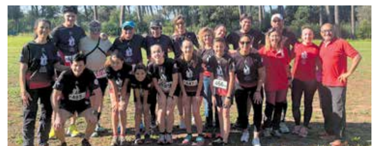
L'equip del Club Atlètic Calderí en una imatge de la 12a edició.

És una prova sense grans pretensions, de format familiar, que significa el dia de gran celebració per a la família del Club Atlètic Calderí. Un any més, torna la Cursa del Dimoni i ho farà el 24 de maig, amb la seva 13a edició a l'entorn natural de Torre Marimon. A les 9:30 hores es preveu l'arrencada de la Cursa Open (de 300 places) en el marc de la qual es podrà optar entre dues distàncies i sortida conjunta. Entorn les 11 hores tindran lloc les curses infantils en les diverses categories i distàncies (de 100 places), i la cursa no competitiva per als més petits. Cal tramitar les inscripcions a running.cat .