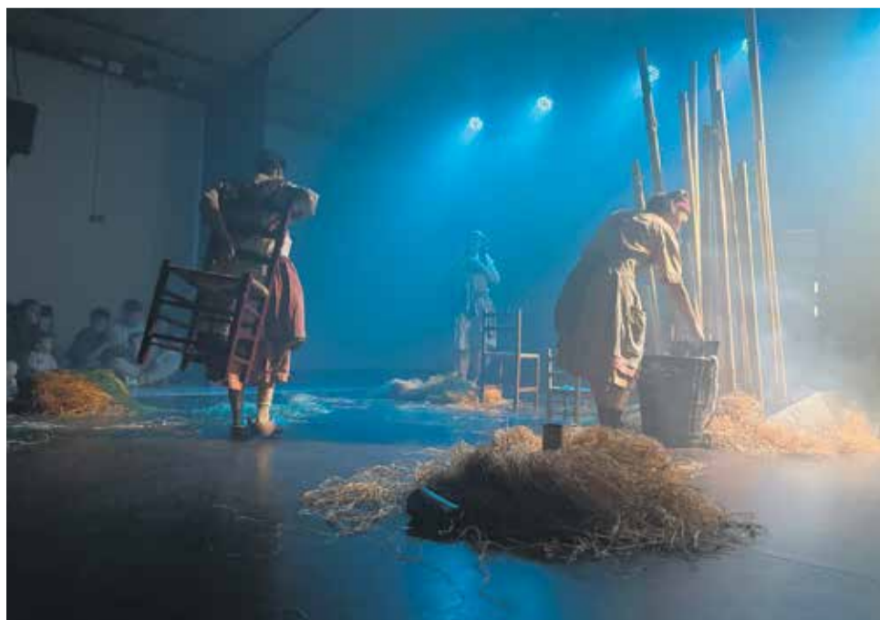
Enguany, la festivitat ha estat marcada per a una inèdita programació cultural amb motiu de Sant Jordi. Tres espectacles (Bon Vent!, Mazoni i Nallar) han arrodonit la celebració d'aquest 23 d'abril a Caldes.