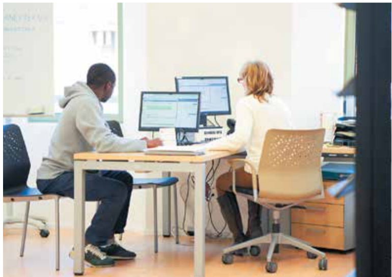
El servei d'atenció de La Piqueta, ubicat a El Carme.

L'atenció a les persones en la cerca de feina, creació de formació professional específica per a elles i contacte diari amb les empreses locals per a mantenir accessible i actualitzada la borsa de treball. Aquestes són les principals línies d'actuació del Servei d'Ocupació, de La Piqueta, que des del mes de febrer estrena instal·lacions al nou equipament