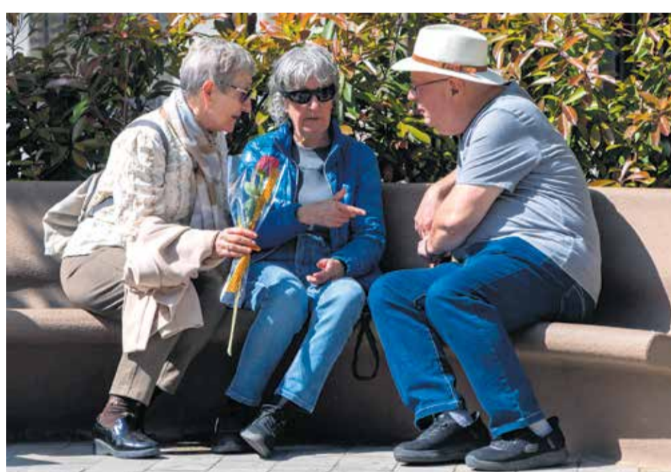
La tradició no sobreviu sense ser compartida amb les persones que ens envolten. La diada també serveix per a la cohesió social, la conversa, el retrobament i el sentiment de formar-ne part.