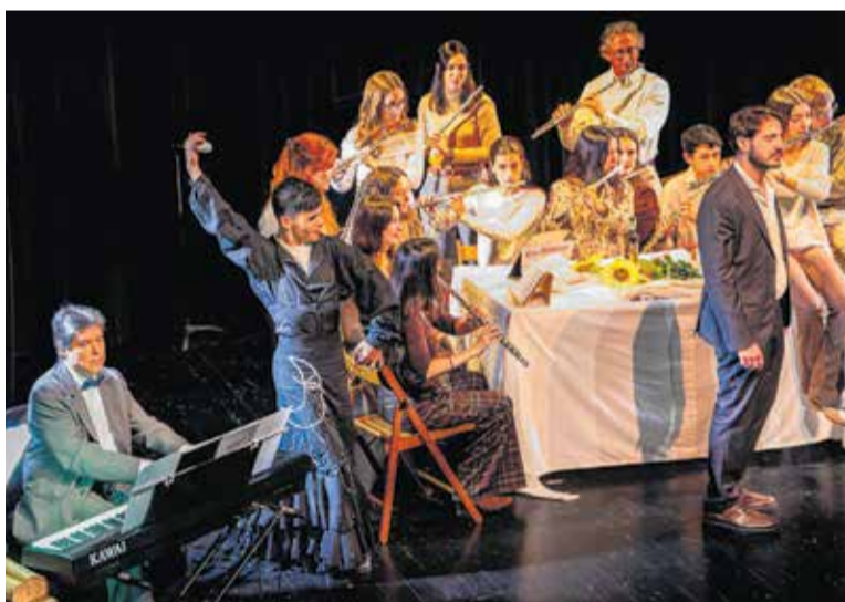
Actuació del grup Flaustaff a Castellterçol, el desembre del 2025.

Dissabte 16 de maig serà el gran dia dels Escaldats amb la Festa Escaldada que proposa múltiples activitats per a tots els públics, amb diversió ininterrompuda de les 11 hores fins a les 3 hores. Al matí, s'habilitarà inflables i jocs per als més petits, la festa d'escuma, concerts i vermut musical. A la tarda, seguirà el bingo musical, activitats i jocs tradicionals (com la Escaldabirres) i la mostra d'entitats (a partir de les 18 hores). Tot seguit, s'oferirà el sopar amb entrepans a preus populars, un espectacle d'Improshow i concerts i dj's fins a la matinada. El parc de l'Estació acollirà la gran festa, oberta a tota la població.