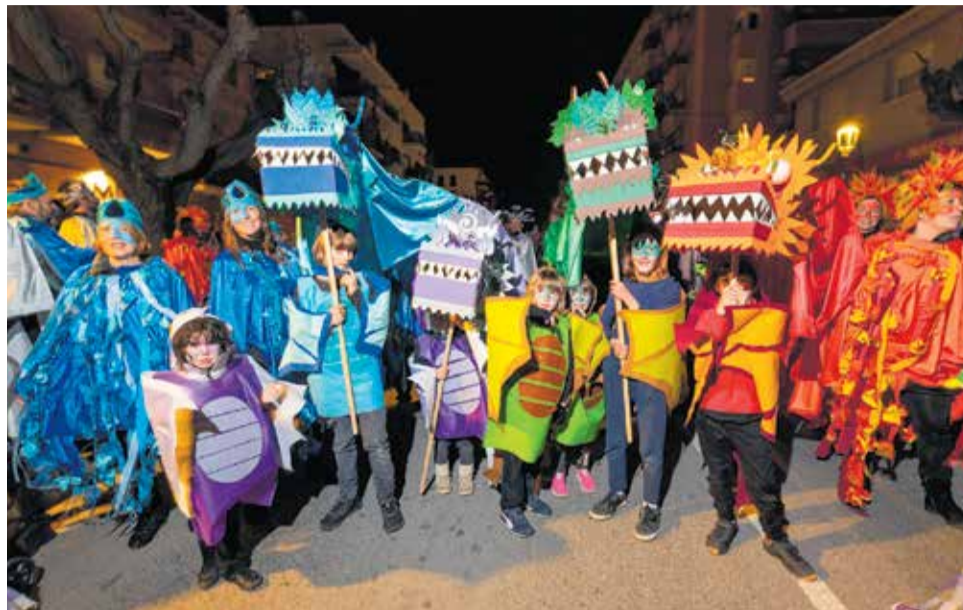
Una de les comparses participants en la rua i el concurs de disfresses de l'any passat.