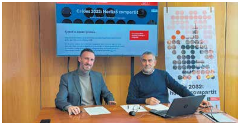
L'alcalde i el regidor de Participació, en la presentació del 26 de gener.

L'Ajuntament impulsa un nou projecte de participació i implicació ciutadana que definirà el futur del municipi per als pròxims 7 anys