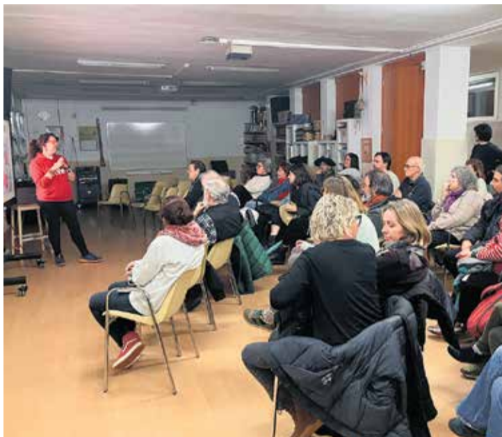
L'acte obert a tothom va tenir lloc el 27 de gener, a l'escola El Farell.

DE L'ESCOLA A CALDES I DE CALDES A LA RESTA DEL MÓN Enguany, el Comitè de Solidaritat es va proposar convidar una entitat important amb motiu del DENIP, i “vam escollir Open Arms perquè admirem profundament la seva tasca humanitària” , continua Ferreres. Aquest, però, no és l'únic projecte en el qual treballa l'organització durant l'any, sinó que, amb la voluntat de crear xarxa i sumar sinèrgies amb altres entitats locals, el grup col·labora amb Caldes Solidària dins del col·lectiu Aturem les Guerres des de Caldes, i amb l'Ajuntament. En aquest sentit, el Comitè ha estat reflexionant sobre el seu paper dins del