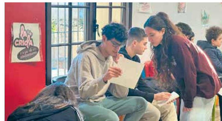
Representants dels instituts de Caldes en la 1a sessió del fòrum.

Dimecres 28 de gener, Caldes de Montbui va celebrar la primera trobada de joves en el marc de La Crida, Fòrum de les Adolescències , a l'equipament per a joves El Toc. Dinamitzada per l'equip de Joventut de l'Ajuntament, una vintena de joves –representants de 1r a 4t d'ESO dels instituts de la vila– van assistir en aquesta primera sessió que va servir per estrenar el fòrum i establir la dinàmica de funcionament del nou projecte municipal; un nou espai de reflexió i debat per fer de portaveu amb l'administració, i que ve a donar continuïtat al Consell d'Infants, adreçat específicament a adolescents de 12 a 16 anys. Les pròximes sessions, que seran el tercer dimecres de cada mes, es faran també a l'Espai Jove El Toc, excepte la darrera que tindrà lloc a la sala de plens de l'Ajuntament.