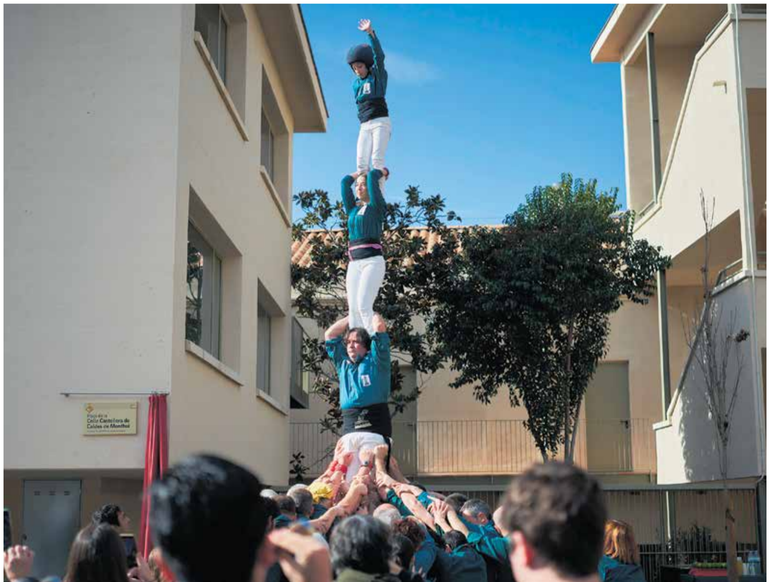
Després dels parlaments i la descoberta de la placa, la colla va pujar un pilar amb motiu de la inauguració de l'espai dins dels actes del 30è aniversari.

En la jornada de diumenge, després de descobrir la plaça i bufar les espelmes, representants del consistori i de la junta de l'entitat van anunciar dos projectes importants per a la colla: d'una banda, que la plaça lluirà un mural dedicat als castellers a càrrec de l'artista Raúl Paredes i, d'altra banda, que una part del Centre Cívic Cultural es conver-