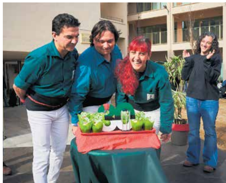
Membres dels Escaldats bufen les espelmes dels 30 anys.