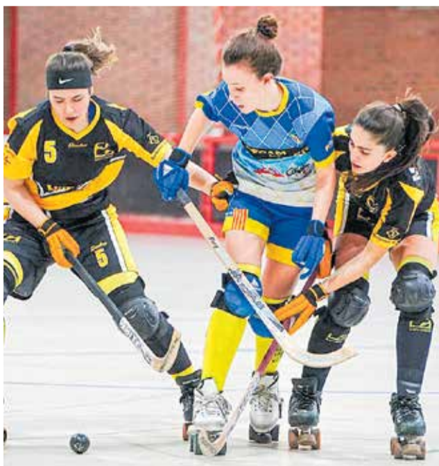
Jugada de la final femenina entre Caldes i Mataró. > CH CALDES