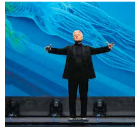
Aquest divendres, al Casino.

Després de l'èxit de l'última estada de Carles Sans a Caldes de Montbui l'octubre del 2025, l'actor i membre de l'històric Tricicle torna al Casino, aquest divendres 6 de febrer, amb l'espectacle "Per fi me'n vaig!". En aquesta ocasió, Sans presenta un muntatge dirigit per ell mateix i per José Corbacho, on combina l'humor, la gestualitat i les anècdotes, mentre ofereix un repàs divertit, íntim i proper a la seva trajectòria artística. La proposta, organitzada per TSC Producciones, pretén emocionar i fer riure als seguidors de Tricicle, així com al públic que vulgui descobrir una nova etapa del recorregut escènic del protagonista.