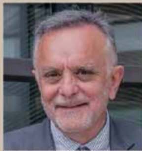
SJD Sant Joan de Déu Barcelona · Hospital

Envia'ns el missatge publicitari i les teves dades de contacte a hola@calderi.cat o trucant al 93 707 00 97.