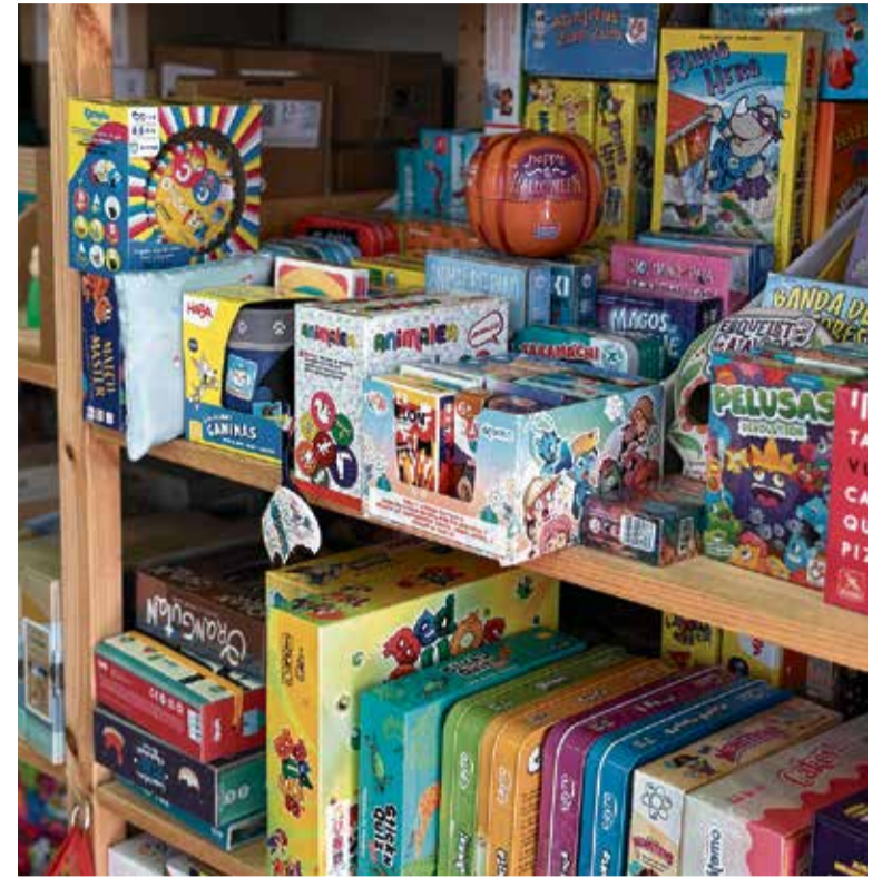
Els jocs de taula, els grans protagonistes de la jornada Caldes Juga.

Des d'ahir, dilluns 5 de maig, està en marxa un nou joc d'enigmes, en el marc del Caldes Juga. Vuit comerços del Centre Històric s'han adherit en la iniciativa, de manera que a la porta de cada un d'ells s'hi troba un enigma a resoldre: "Quan s'obtinguin el 8 segell dels enigmes, podran dipositar el seu targetó a les urnes (a Planeta Tucan i Ca l'Alvero), i d'entre totes les butlletes, el dia 25 farem el sorteig d'un sopar per a quatre persones i jocs de taula" .