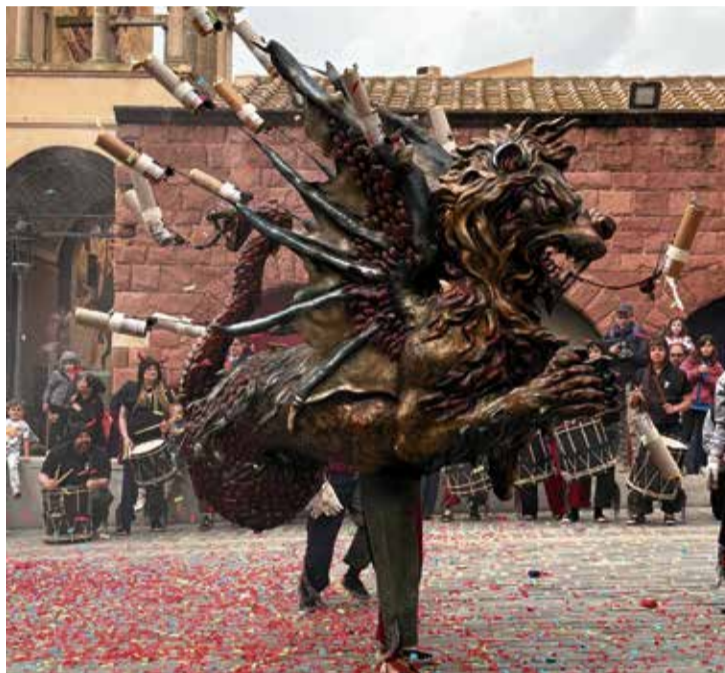
El lluïment de la Godra, entre confeti, en la festa del seu aniversari.

té molta estima i ens omple d'orgull donar-la a conèixer arreu de Catalunya” . Després de 25 anys, en els quals la quimera s'ha convertit en un element icònic de la colla i de la vila termal, l'entitat va organitzar una gran trobada popular amb la participació d'altres entitats i múltiples activitats: “Hem innovat alguns actes, com el seminari de versots (que ens feia molta il·lusió) i el dinar amb una arrossada popular. També vam convidar altres colles per fer-ne més lluïment: va ser com celebrar l'aniversari de la Godra amb les seves amigues, la resta de colles de cultura popular de Caldes” . La bèstia amb cap de lleó, cua de serp, ales de ratpenat i escates a algunes parts del cos representa l'esperit malèvol de la Font del Lleó, i “veure-la en acció és sempre molt impactant. Ens posa els pèls de punta, és espectacular!” .