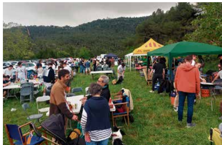
Participants a l'aplec de l'1 de maig, a Sant Sebastià de Montmajor.

un miler de persones han participat en l'edició del 2025, que va començar ben d'hora el matí amb les dues caminades que arrencaven la pujada fins a l'ermita des de la plaça de la Font del Lleó, organitzades pel CECMO. Durant la jornada, es van exhaurir les places de tots els tallers i activitats, i la barra popular també va exhaurir el seu estoc de productes. Unes 180 persones van participar en el concurs de paelles d'Aimava i l'Església de Sant Sebastià va ser l'escenari del concert de flautes del duet Ayres. A més, la cultura popular també va ser part activa de la festivitat, amb les tradicionals sardanes i bastons, a més del ball i els concerts de tarda.