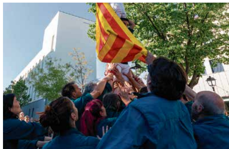
Els Escaldats, en la seva actuació castellera el dia de Sant Jordi.

l'actuació dels Escaldats a la plaça Catalunya, juntament amb les colles castelleres convidades d'Esplugues i Castellar del Vallès. A les 20 hores, serà el torn de l'actuació d'altres entitats de cultura popular, al seu retorn al parc de l'Estació, on s'oferirà entrepans per sopar i, a partir de les 22 hores, arrencaran els concerts en directe de Présseks, Pasqual i els Desnatats, i DJ Putxi.