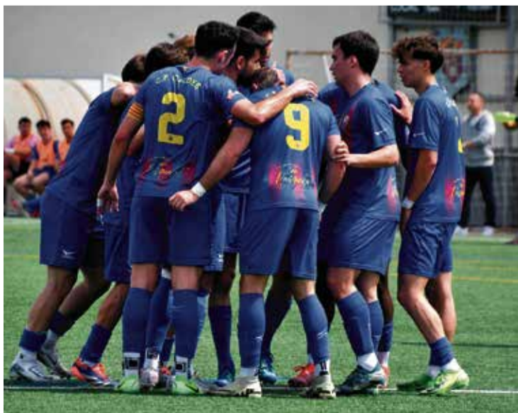
El Caldes celebrant el resultat victoriós contra el Montcada.

El sènior del CF Caldes encara les dues últimes jornades de lliga amb possibilitats de certificar la seva permanència a la categoria de Primera Catalana