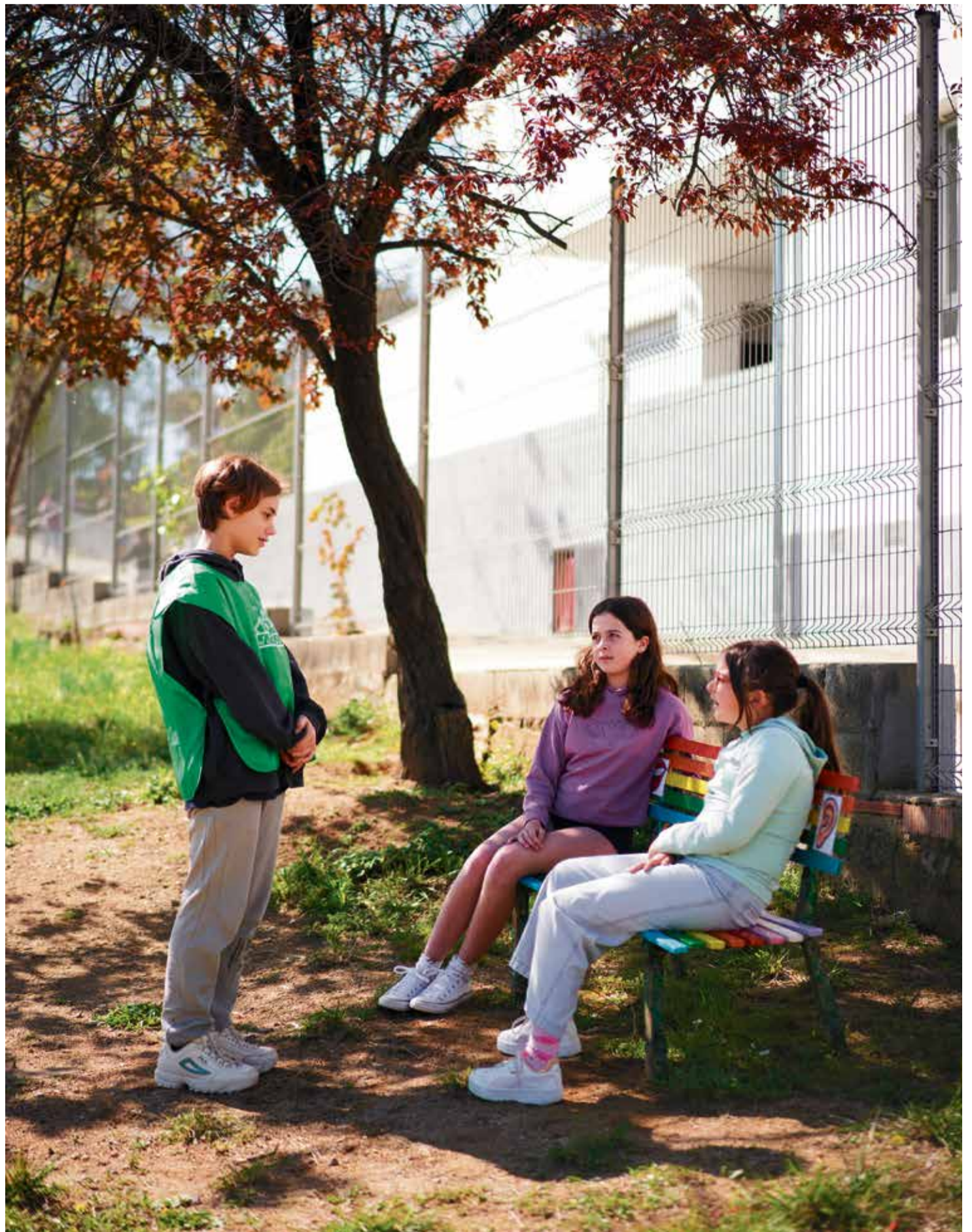
Tres alumnes parlen des d'un dels tres banc de l'amistat que l'Escola Montbui ha creat com espais per a la resolució de conflictes a l'hora de pati.