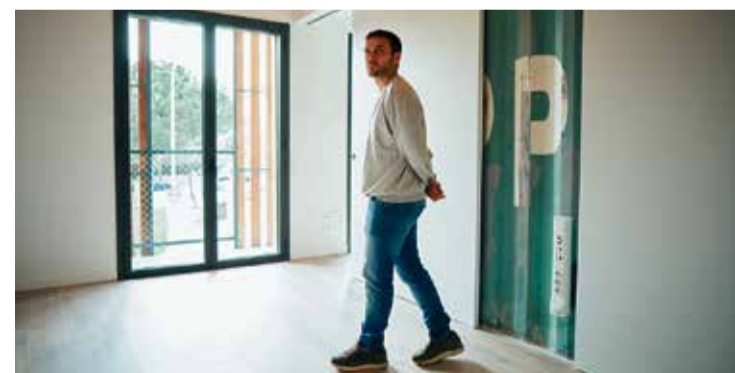
Un dels llogaters en l'entrega de claus d'un habitatge per a joves

El programa Habitatge Jove, impulsat per l'Ajuntament i l'Agència d'Habitatge de Catalunya, ha completat l'arrendament dels vuit habitatges dels quals disposa, adreçats al lloguer social per al jovent de Caldes. Ara, el consistori preveu la creació d'una borsa a partir de les persones joves inscrites al Registre de Sol·licitants d'Habitatges amb Protecció Oficial (RSHPO) que, complint els requisits indicats a les bases, puguin accedir al programa en el supòsit que alguna de les persones arrendatàries d'algun dels habitatges finalitzés la seva participació en el programa. Les persones interessades han d'adreçar-se a l'Oficina Local d'Habitatge, ubicada a l'Ajuntament.