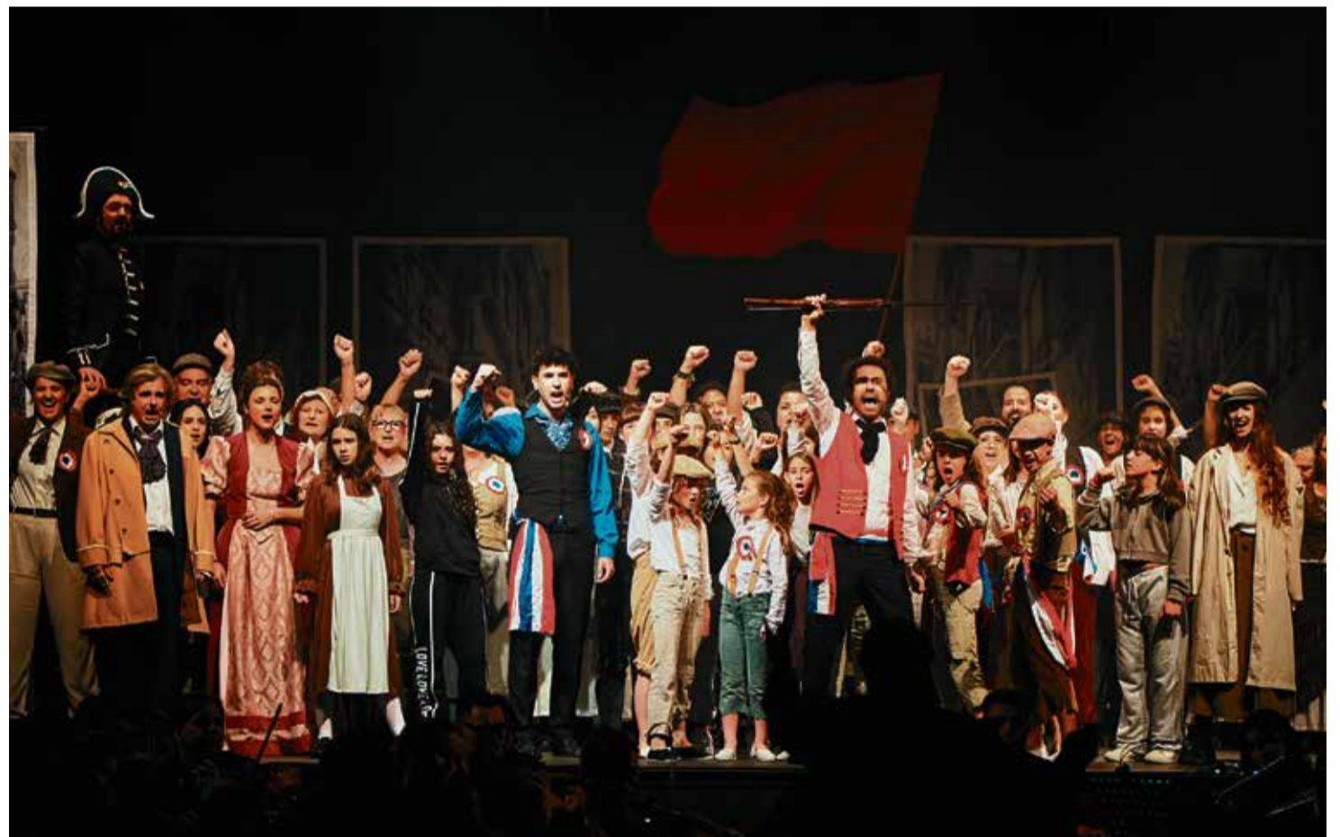
La representació d'Els Miserables de Vocàlic va obtenir el reconeixement del públic, que va aplaudir dempeus al final de la funció. > Q.PASCUAL

L'estrena del sisè musical participatiu i solidari va omplir la Sala Gran del Casino de Caldes el passat 27 d'abril, una súperproducció realitzada gràcies a unes 300 persones, amb un cor de 100 cantaires, 6 corals i una orquestra simfònica