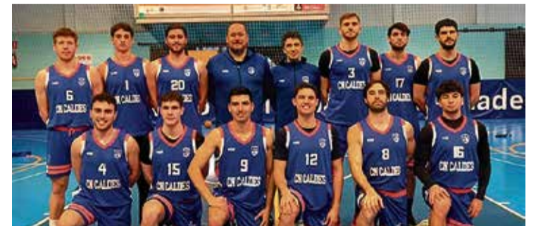
L'equip sènior masculí del CN Caldes de l'actual temporada.