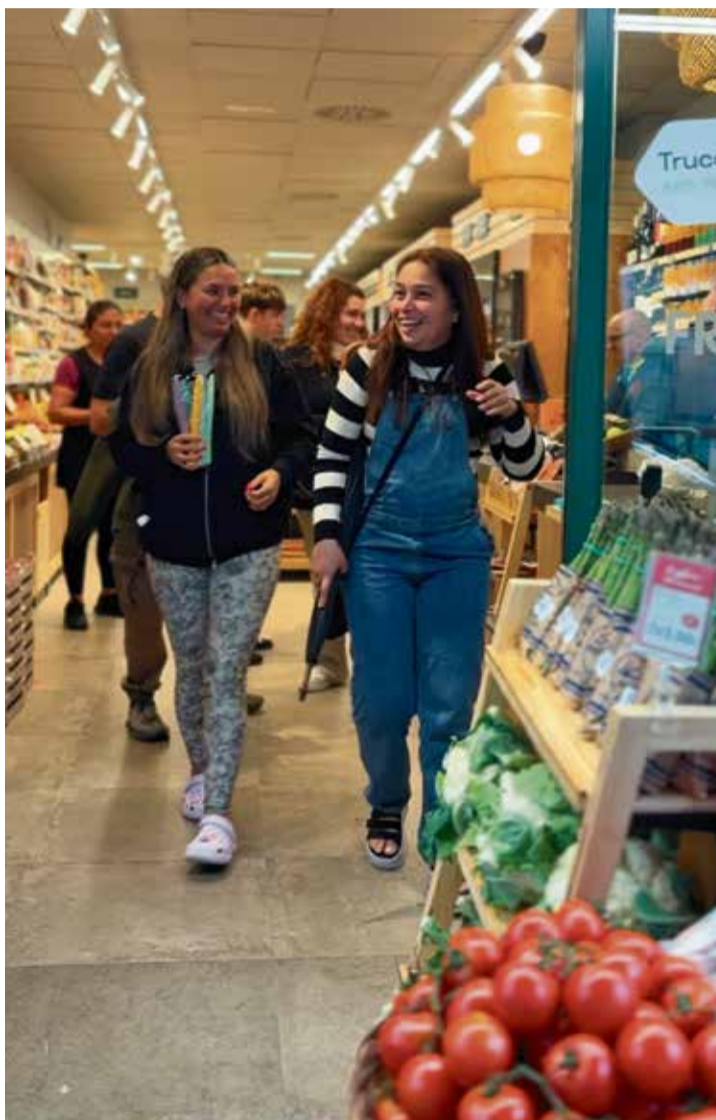
L'alegria compartida en el retorn de la llum a comerços de la vila.

Dies després de l'incident generalitzat, tècnics i especialistes del sector continuen analitzant les possibles causes que poden haver provocat la caiguda del sistema arreu del territori, "quelcom que el sector coneixia, però que ningú creia que arribés a succeir", apunta Oriol Xalabarder, conseller delegat d'Electra Caldense. Segons explica, "la xarxa de transport es controla des de dues variables: el voltatge i la freqüència, i aquesta última es va perdre (arran de la poca capacitat d'inèrcia que hi havia dins de la generació, quan hi havia molta fotovoltaica i eòlica), i això va causar que caigués la generació de fotovoltaica i, finalment, tot el sistema general". En aquest sentit, Xalabarder exculpa les energies renovables, ja que, de fet, "la culpable va ser una central que va caure", de manera que l'explicació tècnica apunta a "tota aquesta electrònica de potència que és la que gestiona el sistema i que no permet gestionar la freqüència d'una manera fàcil, podent generar aquests problemes".