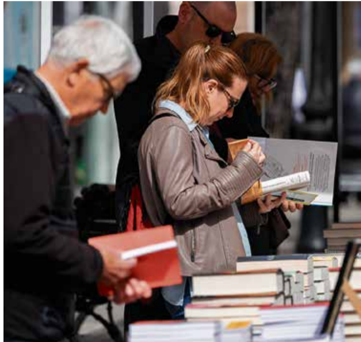
Les parades de roses i llibres s'ubicaran a l'avinguda Pi i Margall. > J.SERRA

en directe recollint l'essència de la jornada. Pel que fa El Centre, Ateu Democràtic i Progresista, l'entitat participarà en la jornada amb una parada que acollirà publicacions de temàtiques diverses, sempre entorn "els valors que des d'El Centre volem transmetre a les persones" . El 24 d'abril, el Casino acollirà el lliurament de premis del XVIII Concurs de Contes Infantils Les veus dels somnis , organitzat per Acció Cívica Calderina. El 25 d'abril, els alumnes de l'EMM Joan Valls oferiran la cantata El gegant egoista a la Sala Noble de Can Rius. I el 26 d'abril se celebrarà la 8a Trobada de Bèsties que, en aquesta ocasió, servirà per commemorar el 25è aniversari de la Godra amb activitats durant tot el dia a la plaça de la Font del Lleó. També s'hi celebrarà el concert de l'Orquestra Municipal de l'EMM Joan Valls a la Sala Noble de Can Rius.