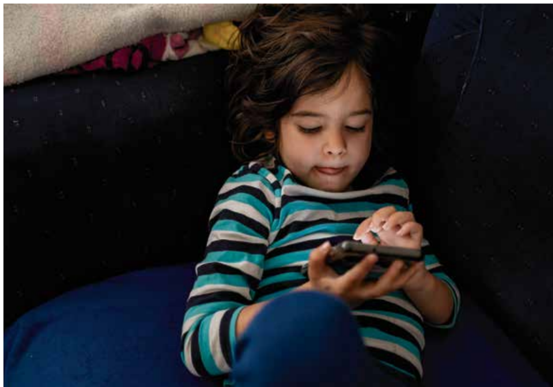
La sessió de reflexió sobre l'ús i exposició a les pantalles tindrà lloc a Les Cases dels Mestres, a les 17 hores.