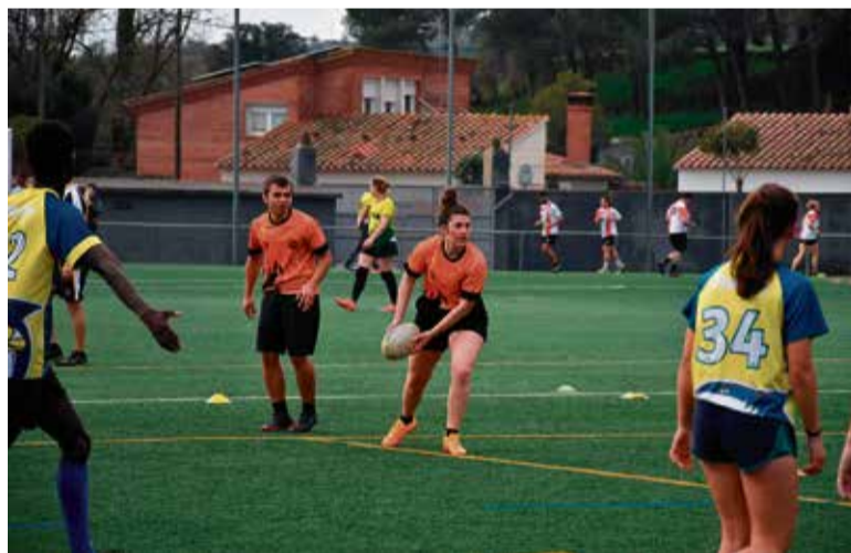
L'equip calderí en una acció durant la jornada celebrada a Caldes.

En general, el conjunt de la Flama Taronja va valorar molt positivament la jornada que va acollir el municipi, "tant pel que fa a l'aspecte esportiu com en el clima de companyonia", malgrat la pluja intermitent i la lesió d'una jugadora de l'equip d'Osona que va requerir ser evacuada en ambulància: "Esperem que es recuperi aviat i la tornem a veure als camps".