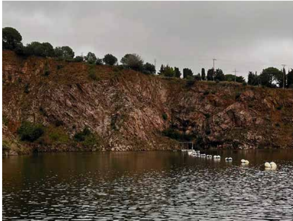
Imatge que mostra les reserves de l'embassament de la Pedrera, el 21 de març.