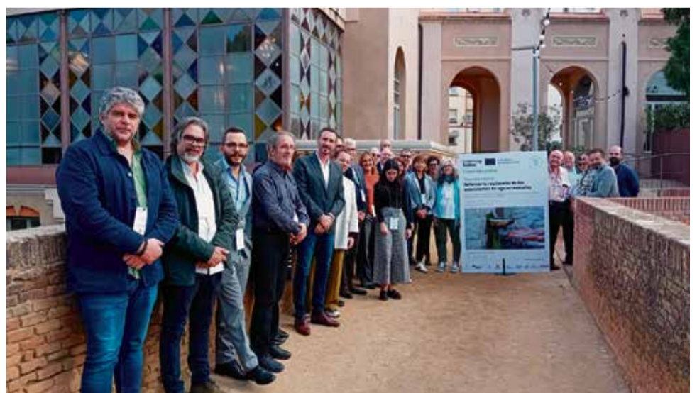
Una trentena d'actors del termalisme europeu en les jornades de treball de Caldes.