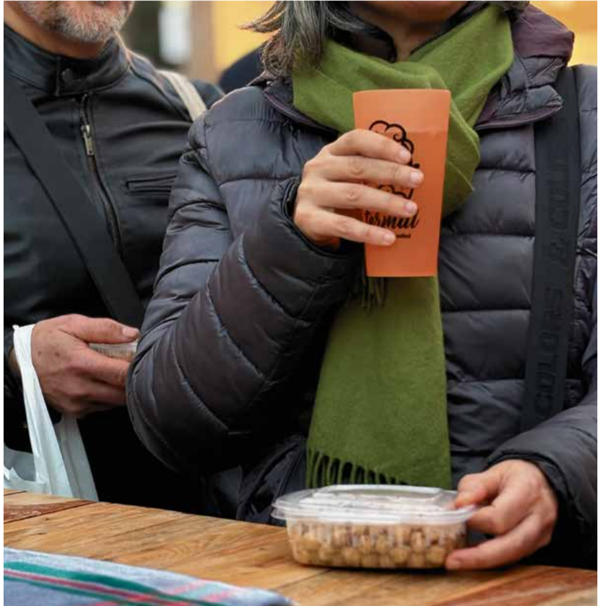
El caldo termal i l'Olla Calderina, els dos grans protagonistes en la 13a edició del Mercat de l'Olla de Caldes.

A banda del tast de l'olla i el caldo termal, l'edició d'enguany es reservava una segona sorpresa, la qual no va ser descoberta fins al migdia del dissabte 15 de març, a la plaça de la Font del Lleó i en el marc del Mercat de l'Olla. El fet és que, sense previ avís, desenes de persones participants en l'espectacle Els Miserables , a càrrec del cor Vocàlic i XICS, van oferir una Flash Mob que va atraure la mirada, i els aplaudiments!, de les persones que visitaven el mercat.