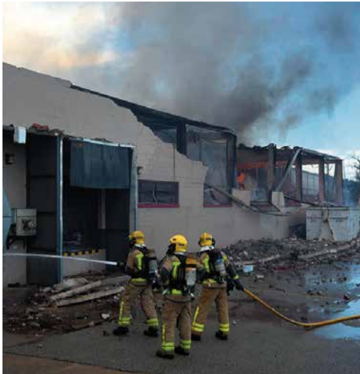
Bombers treballant en l'extinció de l'incendi a la nau. &gt; BOMBERS DE CDM