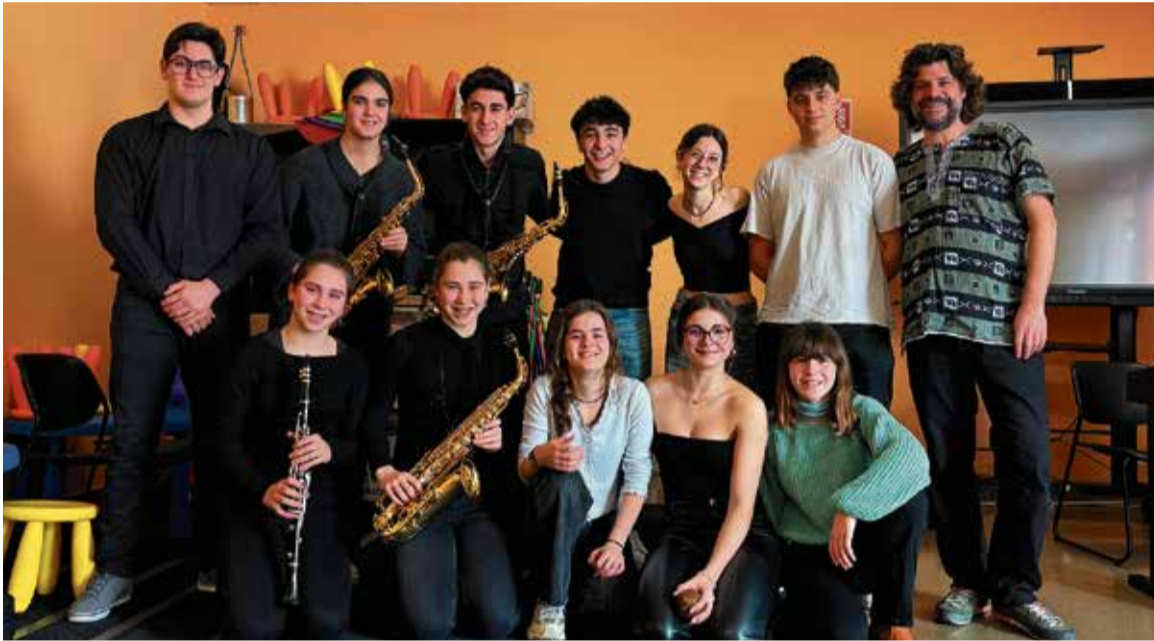
Combo de Joves de l'EMM Joan Valls en l'estada a Navarra, en el marc de l'intercanvi amb l'escola de Barañáin.

Avui i demà, 1 i 2 d'abril, a la tarda, l'equipament municipal restarà obert a les persones interessades per conèixer el centre formatiu