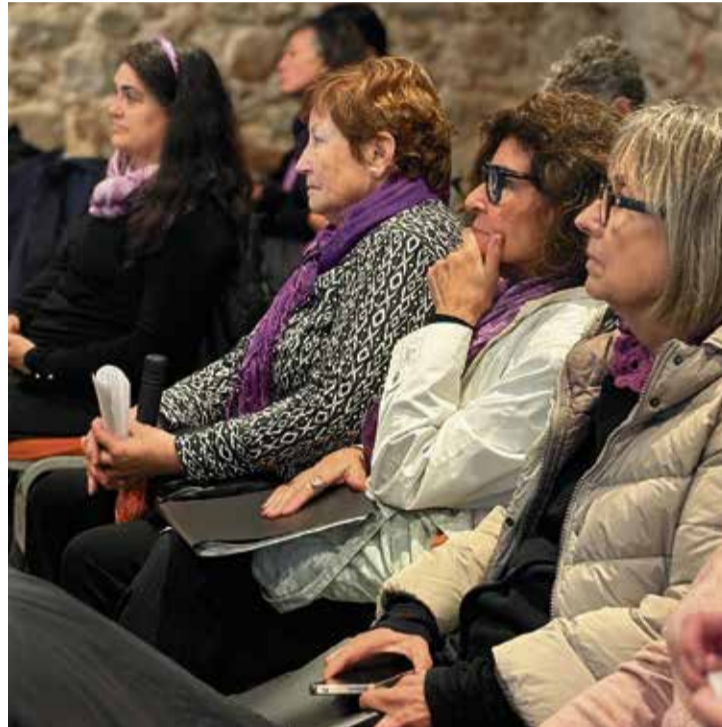
El color lila va ser especialment present durant l'acte a Can Rius. > I.HIJANO

L'acte va continuar amb la lectura del manifest del 8M a càrrec de representants del consistori, i va acabar amb l'actuació del cor Do de Dona amb el seu cant en femení que reivindica la igualtat d'oportunitats.