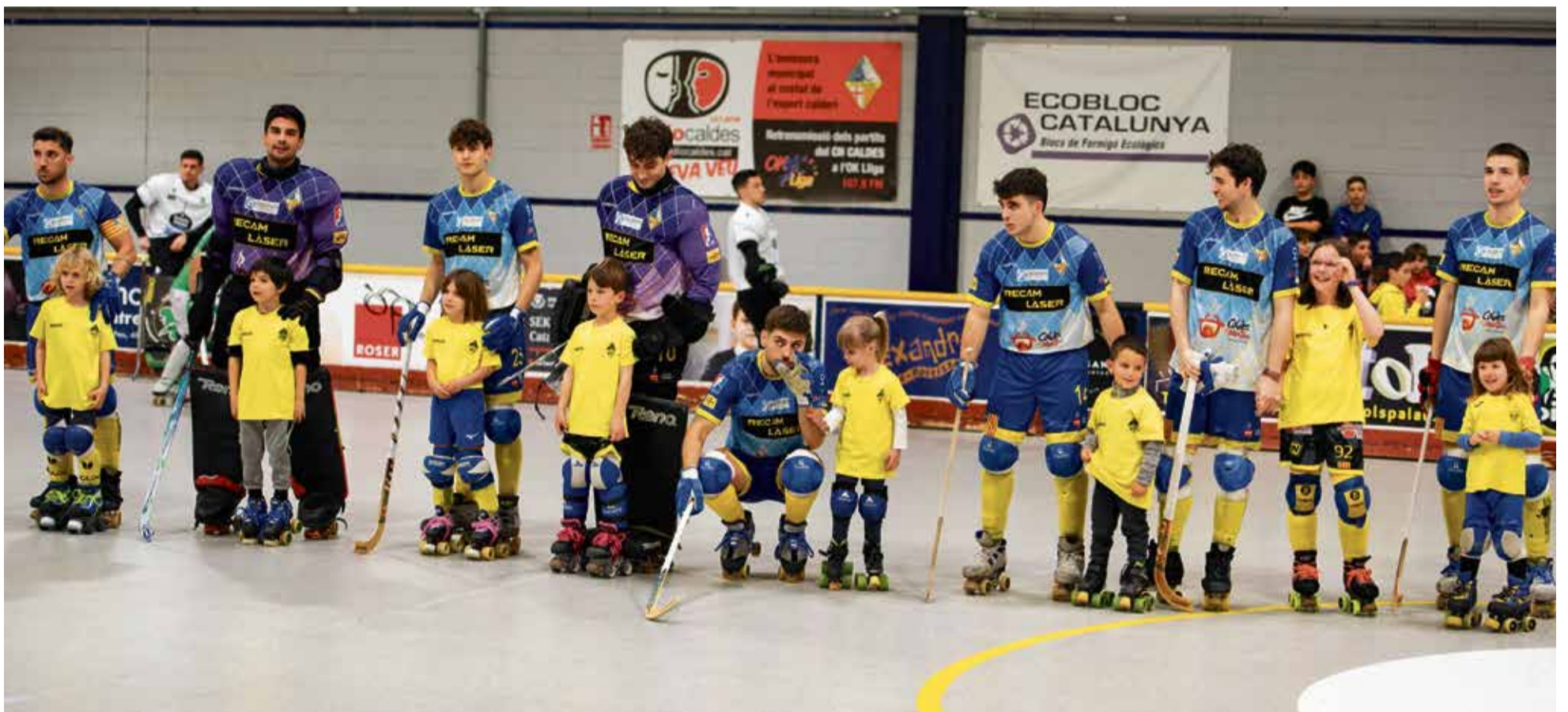
Els jugadors del primer equip del Recam Làser Caldes fotografiats amb els jugadors de l'escoleta del club calderí, en el marc de l'últim partit contra el Liceo, disputat a la Torre Roja.

El Recam Làser Caldes cau davant dels segons de la classificació i queden a tres punts de la promoció de descens