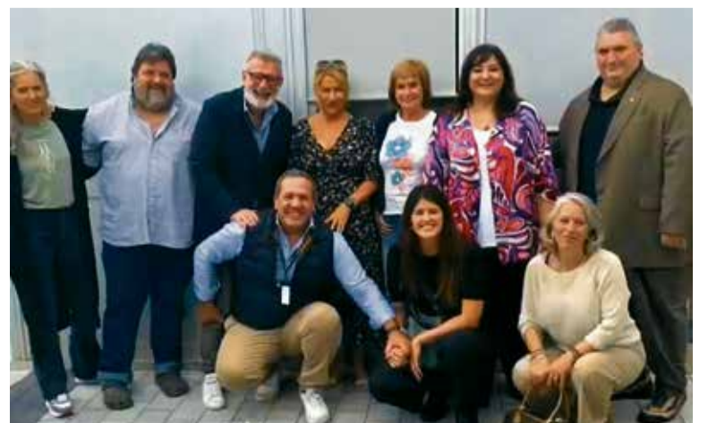
Fotografia de grup amb la Junta i persones voluntàries de l'entitat.

A partir, doncs, del propòsit de trencar barreres i crear les mateixes oportunitats per a totes les persones, l'entitat s'adreça a la ciutadania, empreses i institucions i fa una crida “a formar part del projecte inclusiu, ajudant-nos a crear un entorn més accessible i just per a tothom”.