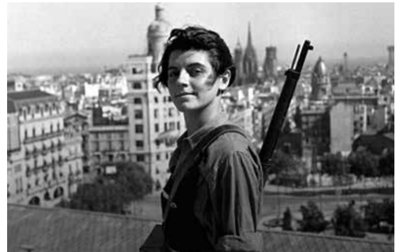
Marina Ginestà (1919-2014) en la popular imatge de l'any 1936.

fia d'ella amb un fusell des de la terrassa de l'antic Hotel Colón a plaça Catalunya. La lectura dramatitzada serà representada a l'escenari del Casino per la companyia de Canet de Mar, 3 Aquaris per a 1 peix. Les entrades són a la venda a http://bit.ly/Casino-Caldes o a taquilla els dijous de 17 a 19 hores.