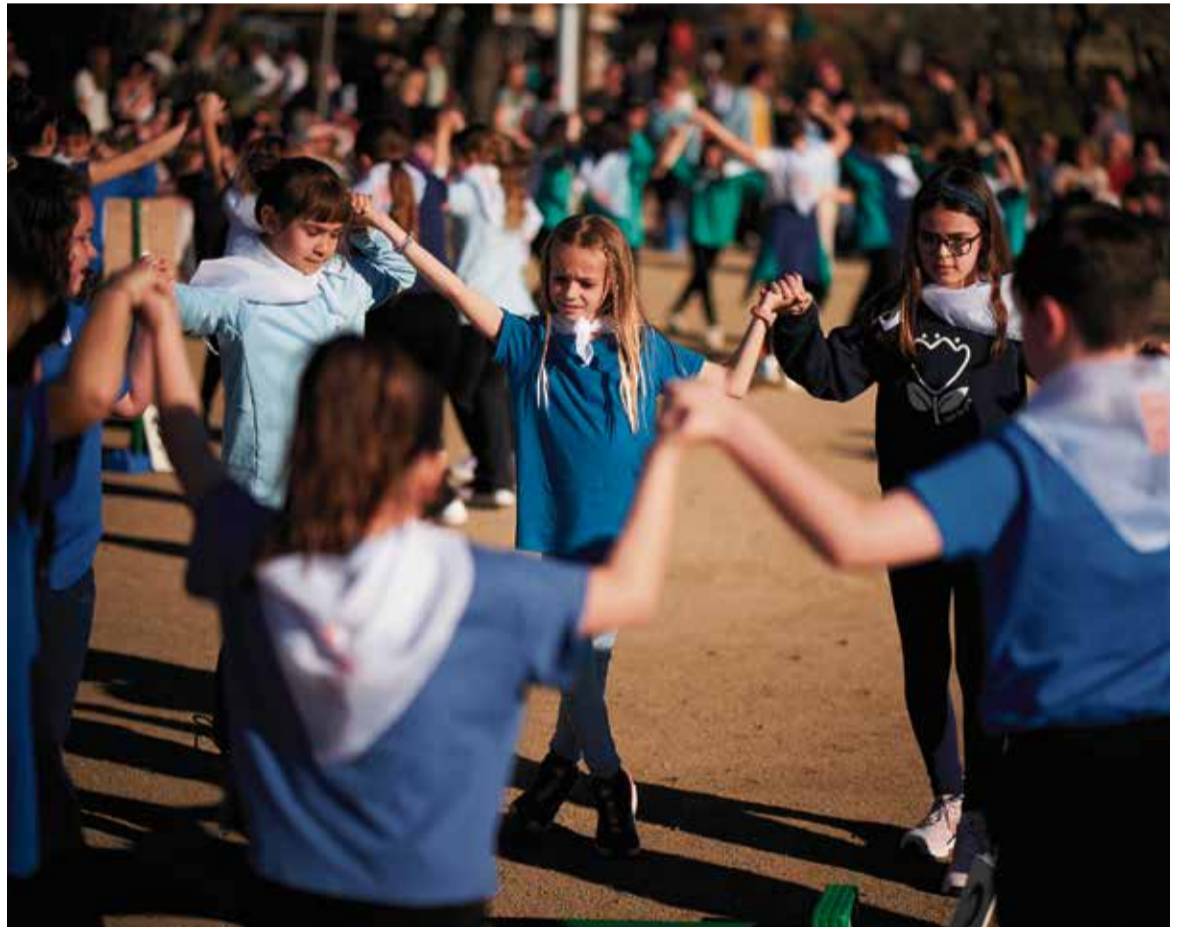
Uns 120 alumnes de les escoles de Caldes, i les seves famílies, van participar en el SardaCaldes d'enguany.