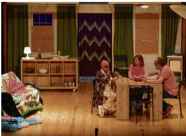
La companyia amateur Ull de Bou en un moment de la representació.

L'Ull de Bou Grup de Teatre, de Sant Esteve de Sesrovires, representarà l'emblemàtica obra Agost , de Tracy Letts. El drama, amb humor negre, explora les tensions familiars a partir de la desaparició del pare dels Weston, que reuneix tres generacions a Oklahoma, desencadenant revelacions que exposen secrets i relacions disfuncionals. Les entrades es poden adquirir de manera anticipada al web www.centredemocratic.cat .