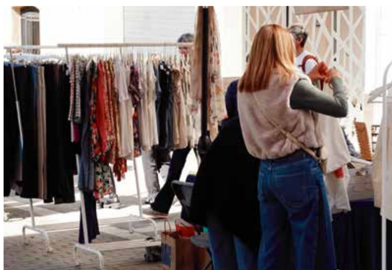
Moda, sabateria, complements i molt més en la fira de diumenge passat. > UCIC

Després de dos ajornaments a causa de la previsió de pluja, la Unió de Comerciants i Industrials de Caldes de Montbui (UCIC) va celebrar una nova edició de la Fira Fora Estocs, el passat diumenge 30 de març, al matí. Una vintena de parades van vestir el carrer Montserrat per oferir un ampli ventall de productes a preus més econòmics, l'oportunitat de comprar reduint la despesa de cada butxaca. Segons han dit portaveus de l'entitat, "ens sentim molt contents amb l'acollida que ha tingut la Fira Fora Estocs. Després de les pluges infinites, hem pogut celebrar-la amb un sol radiant", mentre agraeixen la participació dels socis "i la de tota la gent que ha vingut a gaudir-la".