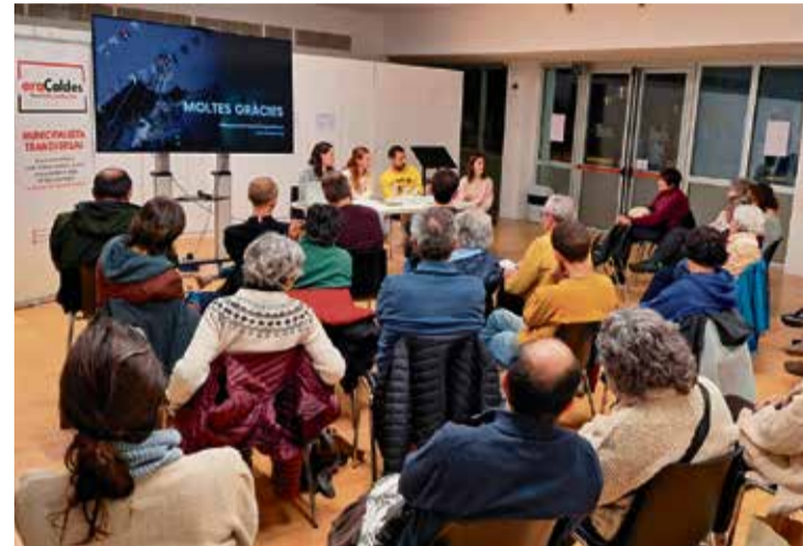
Cloenda de la primera xerrada del nou cicle, estrenat el 12 de març.

Els desafiaments de la mobilitat al Vallès: nova xerrada d'araCaldes, aquesta tarda