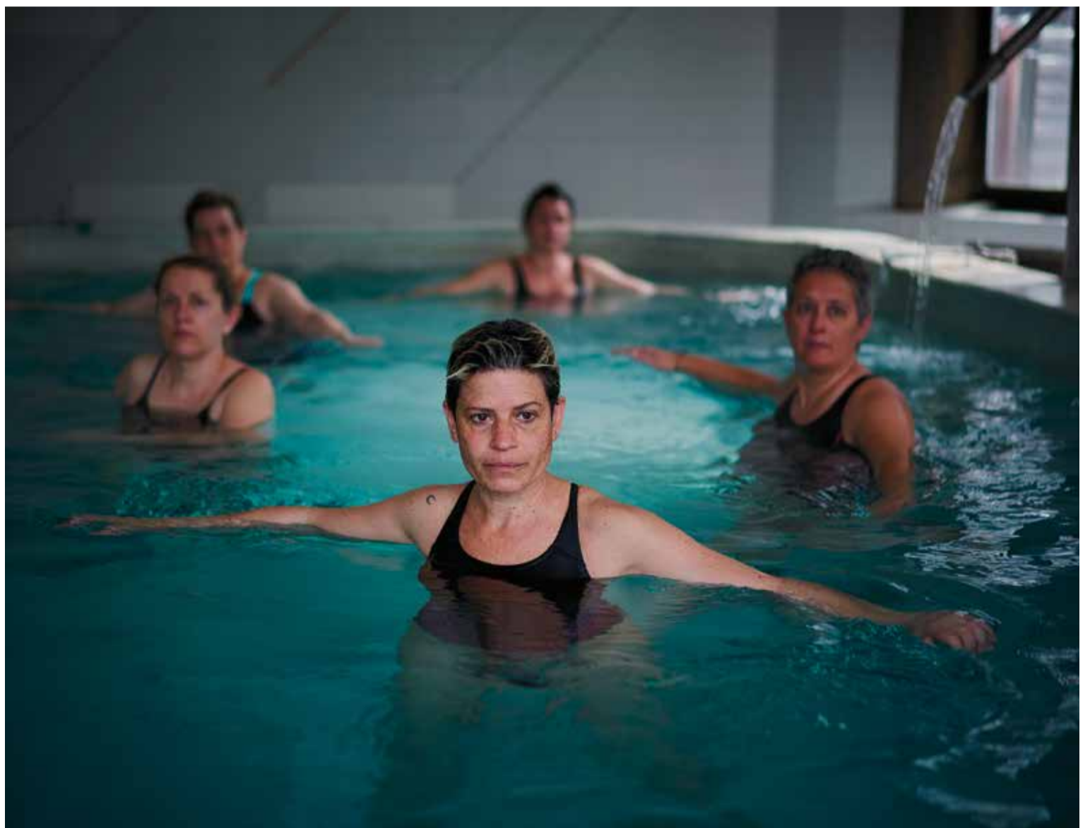
Participants en l'estudi sobre les aigües termals en pacients amb càncer de mama, en una de les darreres sessions de balneoteràpia, al Termes Victòria.

A les paraules de l'alcalde, i en el marc de l'acte de presentació de l'aplicació dels tractaments termals el passat