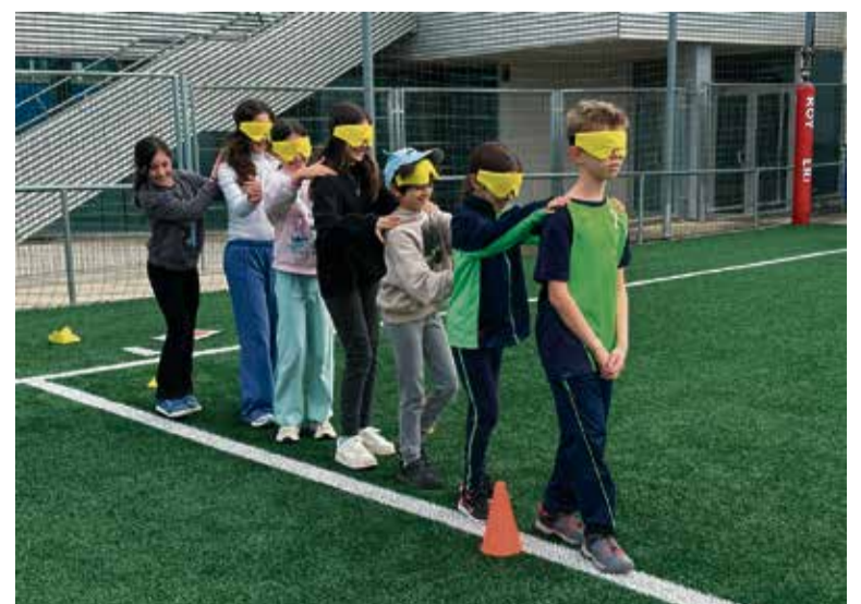
Un grup d'alumnes en el marc de la jornada, el dimecres 26 de març.

En paral·lel, la jornada va comptar amb la participació de la colla dels Castellers de Caldes de Montbui, els Escaldats, els quals van oferir, com en edicions anteriors, un taller de creació de castells als infants. En aquest cas, l'activitat va tenir lloc a l'escola El Farell, a la tarda, i va plantejar-se amb l'objectiu “d'experimentar la pinya castellera amb el seu pilar corresponsent”, afegeix García.