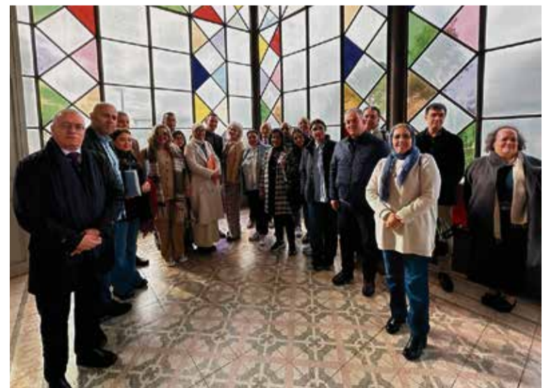
Imatge de grup de les persones visitants i les locals, a la Sala Noble.

El projecte Aizdihar és una iniciativa liderada per la Fundació Ibn Battuta, del qual el Fons Català és soci. L'objectiu que persegueix és la promoció del rol dels MRE (marroquins/es residents a l'estranger) en el desenvolupament socioeconòmic i l'accés a l'ocupació de qualitat sostenible a la Regió de l'Oriental, al Marroc, amb una atenció específica a joves i dones.