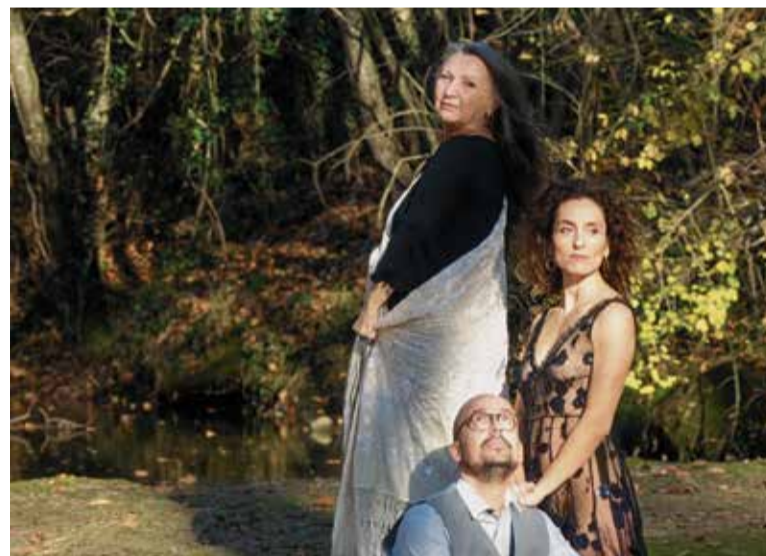
Sicalíptiques es representarà al Casino de Caldes, el 23 de març. > LE CROUPIER

masses local. Les cupletistes es converteixen en les abanderades d'una dona nova, artista i empresària de si mateixa, i perfectament conscient que per construir una avantguarda cal explotar la provocació i l'art de l'escàndol. Sicalíptiques està coproduït per la Federació d'Ateneus de Catalunya que, de març a octubre del 2025, es representarà als diferents ateneus de la Xarxa de Teatres d'Ateneus de Catalunya (XTAC).