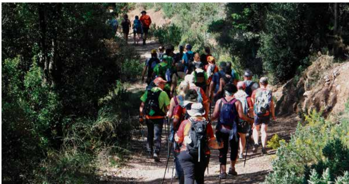
Un grup de participants en l'edició de l'any 2024, en la Caminada de Caldes i Palau a Montserrat.

Demà, dimecres 5 de març, acaba el període d'inscripcions en línia (limitat a 600 persones) per a l'edició d'enguany: La Ruta del Castell de Sentmenat