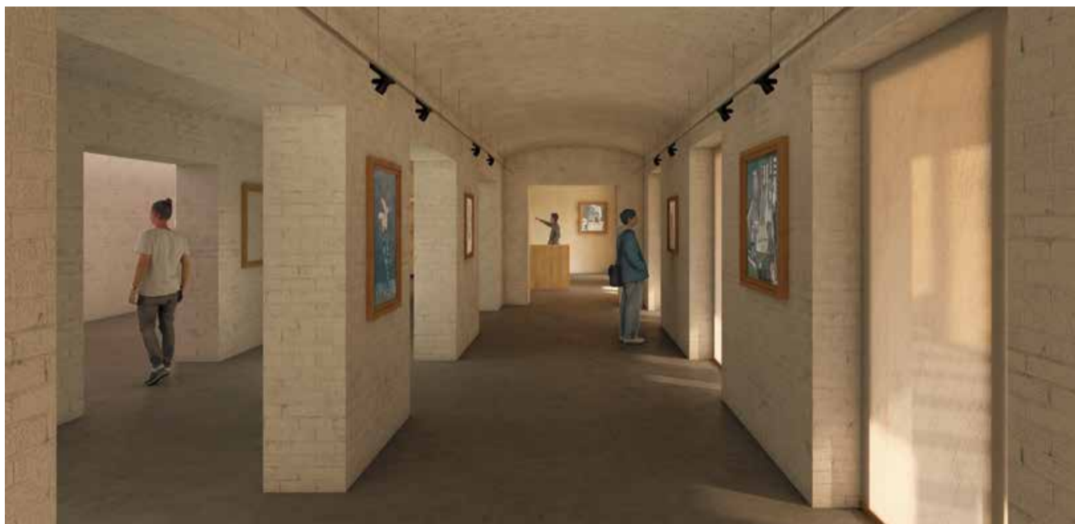
Imatges renderitzades que il·lustren el futur d'un equipament funcional i integrat en l'entorn.

Aquest any 2025 es donarà compliment al deure que restava pendent amb la ciutadania i el municipi de Caldes de Montbui arran del projecte de recuperació d'un dels edificis més emblemàtics a la vila i arreu del territori català. Clar referent en el sector del termalisme a Catalunya durant el segle XIX, el Balneari de Can Rius va ser un dels conjunts termals més importants de l'Estat espanyol que, a partir del seu tancament i amb el decurs dels anys, ha estat catalogat com a bé d'interès local i, per tant, part rellevant del patrimoni històric de Caldes de Montbui.