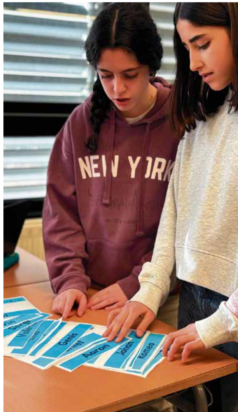
Dues alumnes de 2n d'ESO, preparant els dorsals dels participants.