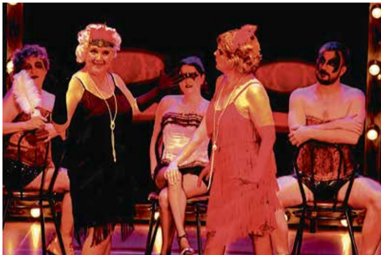
La Cia. Increixendo, en un moment de la funció “Senzillament, nua”.

L'obra amb textos de diverses dramaturgues i a càrrec de la Cia. Increixendo és la proposta d'aquest dissabte en el marc del TACA'M 2025