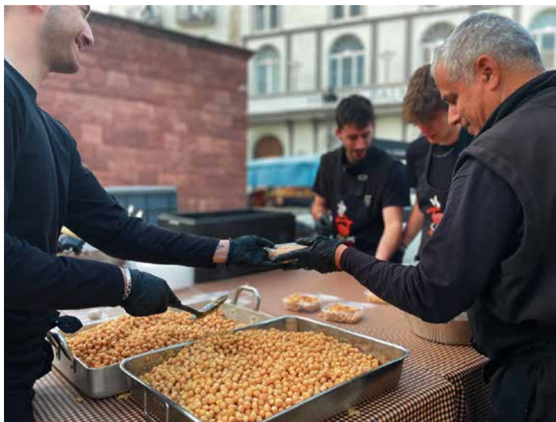
Les llegums cuites amb aigua termal, les grans protagonistes del Mercat de l'Olla, edició rere edició.

Enguany, Catalunya ha rebut la distinció de Regió Mundial de la Gastronomia, convertint-se en la prime-