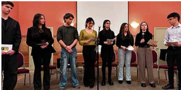
Alumnat de batxillerat de l'Escola Pia, durant la jornada d'exposició.

Arran de la pregunta, els treballs van tractar diverses temàtiques, com són: la relació entre els trets de la personalitat i la reacció als estímuls sensorials; el vincle entre emocions i aprenentatge; la relació entre el bilingüisme i la demència; neurociència; el concepte filosòfic de la bellesa; estoïcisme en l'actua-