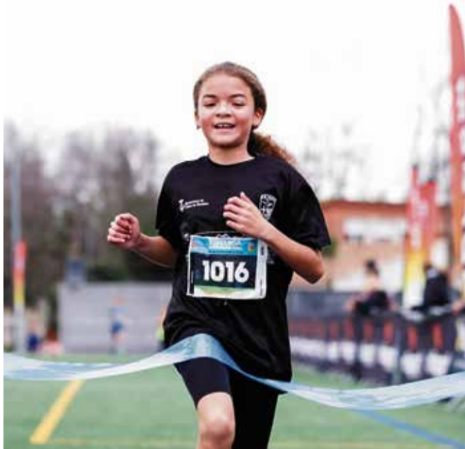
La cursa va comptar amb una destacada participació infantil.