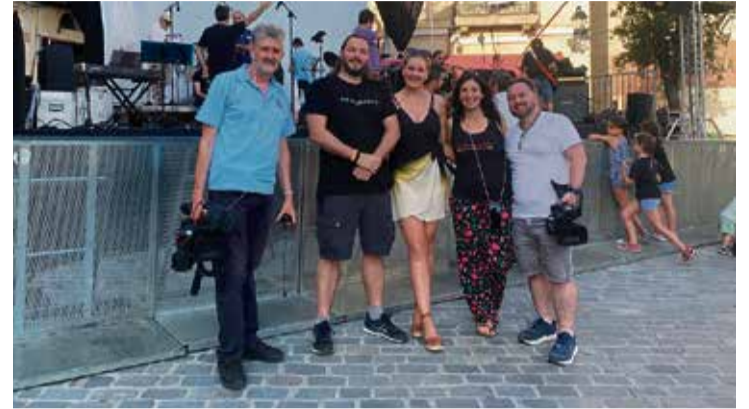
L'equip de rodatge del documental, amb personal de Thermalia.