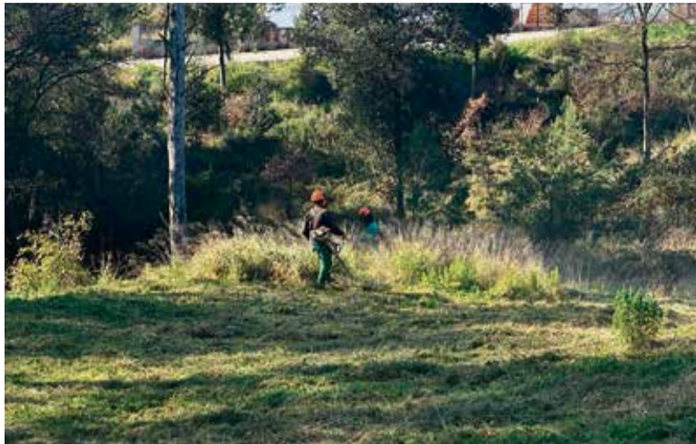
Personal de la Fundació durant el servei a Caldes, divendres passat.

En el marc del contracte actual, enguany es compliran 10 anys des de la signatura del primer contracte entre ambdues entitats; un vincle a partir del qual la Fundació dona ocupació laboral a un equip de cinc treballa-