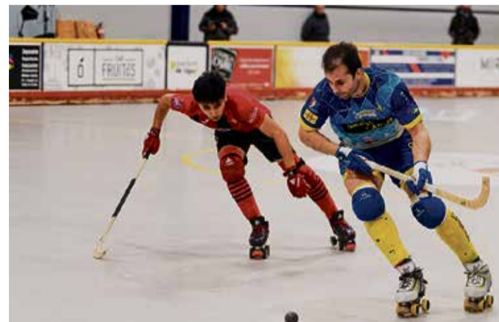
Imatge de l'últim partit d'OK Lliga, abans del descans. > PREMSA CH CALDES

El Recam Làser Caldes reprendrà l'activitat de l'OK Lliga el pròxim 15 de març, després de l'aturada d'aquests dies, i ho farà en un duel directe a la pista del Voltregà. Mentre la cita no arriba, els calderins es mantenen en 9a posició, amb 21 punts en la màxima categoria estatal, i sis victòries acumulades aquesta temporada. > PREMSA CH CALDES