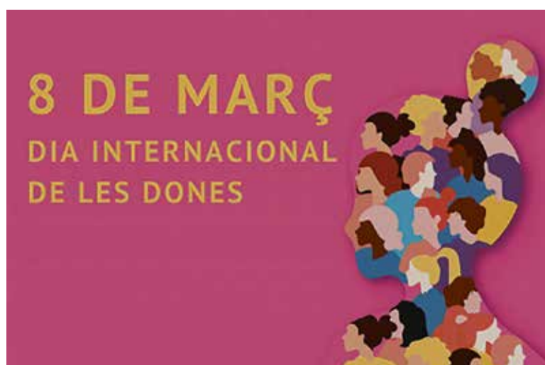
Imatge corporativa del programa d'actes dedicat al 8M, a Caldes.

La commemoració del Dia Internacional de la Dona inclou actes institucionals i d'entitats locals, que s'allargaran durant tot el mes