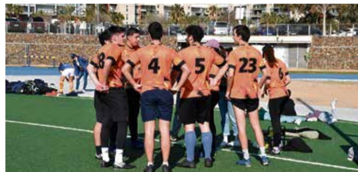
El conjunt calderí en una imatge durant la jornada anterior.

El Rugby & Touch Caldes ha fet una passa més cap a la fase final de la Copa Plata després d'una gran actuació el 9 de febrer a la Mar Bella, seu del CN Poblenou. L'equip va sumar dues victòries “en una jornada que reafirma el bon moment de forma” , apunten des de l'entitat. El primer partit, contra el Touch Cervelló, el Caldes va assolir una victòria per 7 a 2. I, seguidament, es va reafirmar el triomf contra els Foixarda Foxes amb un 8 a 5. Ara, l'equip es prepara per a la pròxima jornada, el 22 de març, on buscar segellar el pas definitiu cap a la següent fase.