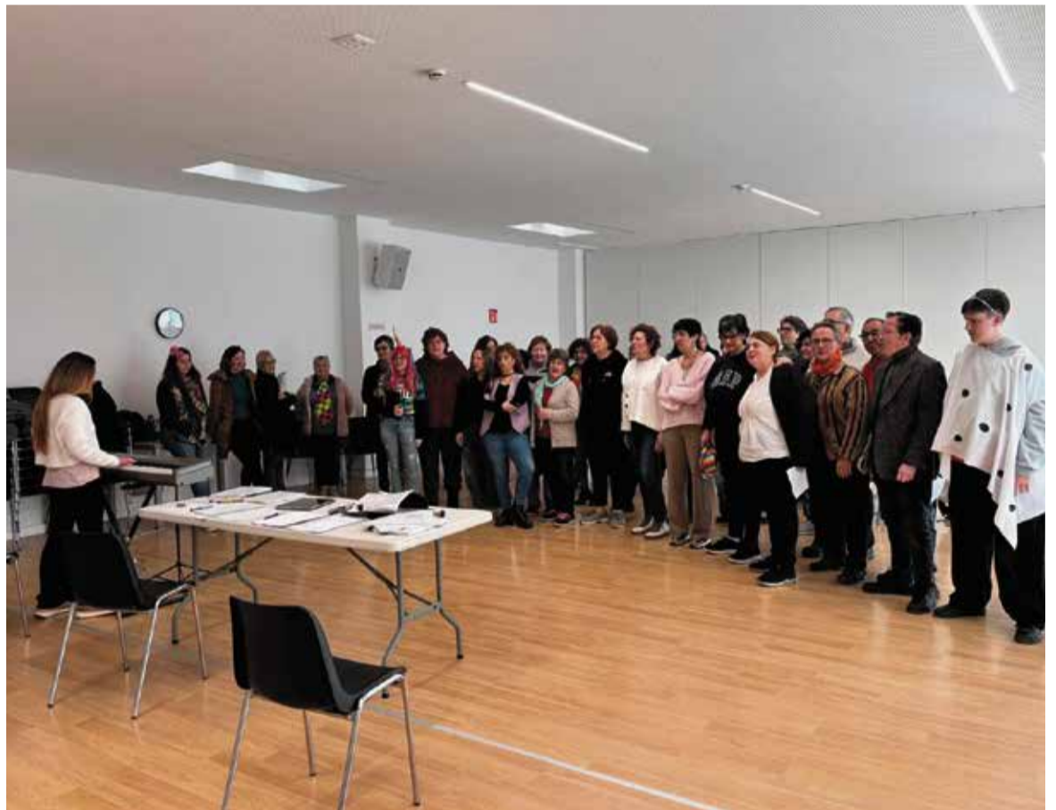
Assaig del concert amb els cantaires de “Juntas som imparables”, a les Cases dels Mestres, l'1 de març.