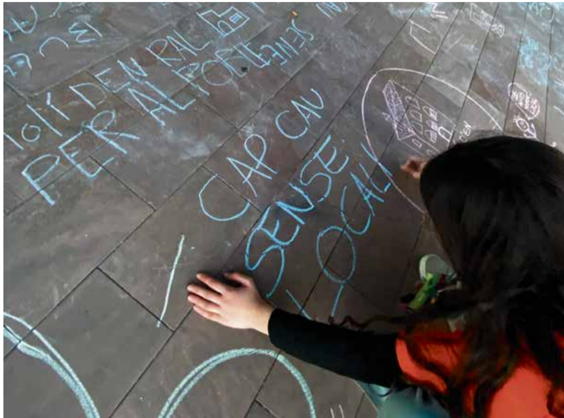
La manifestació va acabar a l'Ajuntament, amb missatges reivindicatius pintats al terra de la porxada.

En aquest context, el diuenge 23 de febrer, l'agrupament va decidir convocar una manifestació oberta a la ciutadania i altres entitats, organitzada per les monitores, que també va comptar amb l'actuació del grup de tabalers de Ball de Diables i la presència de la Godra; un recorregut que va començar al Molí d'en Ral i va acabar davant l'Ajuntament “per explicar aquesta situació que sostenim i fer que ressoni a tot el poble”. Una manifestació, d'altra banda, que “vam plantejar de manera pacífica i lúdica des d'un inici, tenint en compte que som un agrupament amb un