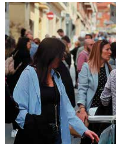
La fira, en edicions anteriors.

Aquest diumenge 9 de març, de 10 a 15 hores, l'UCIC organitza una nova edició de la Fira Fora Estocs al carrer Montserrat. Una vintena de parades vestiran el carrer des d'on aprofitar l'ocasió de comprar un ampli ventall de productes a un preu més ajustat. També, com en altres ocasions, l'entitat oferirà espais dedicats a jocs infantils, adreçats als més petits. Durant aquests dies, comprant als comerços adherits a Caldes Centre Comercial es podran aconseguir tiquets gratuïts per accedir a aquests espais.