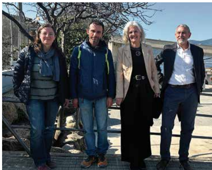
Representants d'AFAs i regidors, davant l'Escola Montbui.

La comunitat escolar posa en marxa la Comissió de mobilitat escolar sostenible