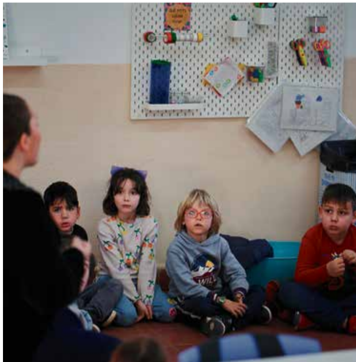
Alumnes de l'Escola El Farell en unes jornades del mes de gener.

Pel que fa al calendari de preinscripció, el període per a dur a terme les sol·licituds s'estendrà del 12 al 26 de març en el cas de l'educació infantil (de 3 a 6 anys) i primària, i del 14 al 26 de març en l'educació secundària.