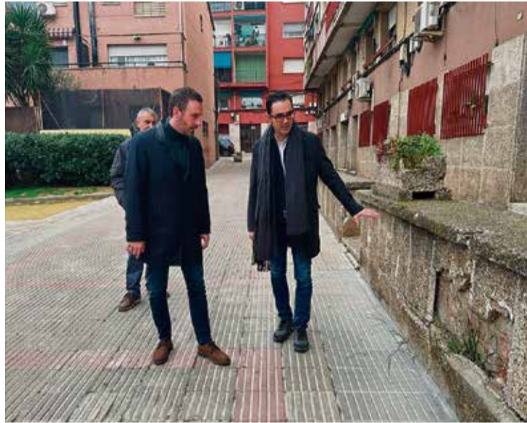
Membres del consistori visitant el mur que serà reparat al Bugarai.

D'una banda, la primera d'aquestes accions és la pavimentació amb formigó, seguint la línia estètica del passeig actual, de la Rambleta del carrer Mossèn Cinto Verdguer, des del carrer de Maria Aurèlia Campmany i fins al carrer de Francesc Domingo. En aquest cas, i aprofitant l'actuació, s'habilitaran dues zones de pas de vianants, adaptades per a persones amb mobilitat reduïda: una, a la cantonada del carrer de Gustavo Adolfo Bécquer, i l'altra amb el carrer Calderón de la Barca. En aquest sentit, també s'adequaran les voreres, rebaixant el nivell per facilitar el pas.