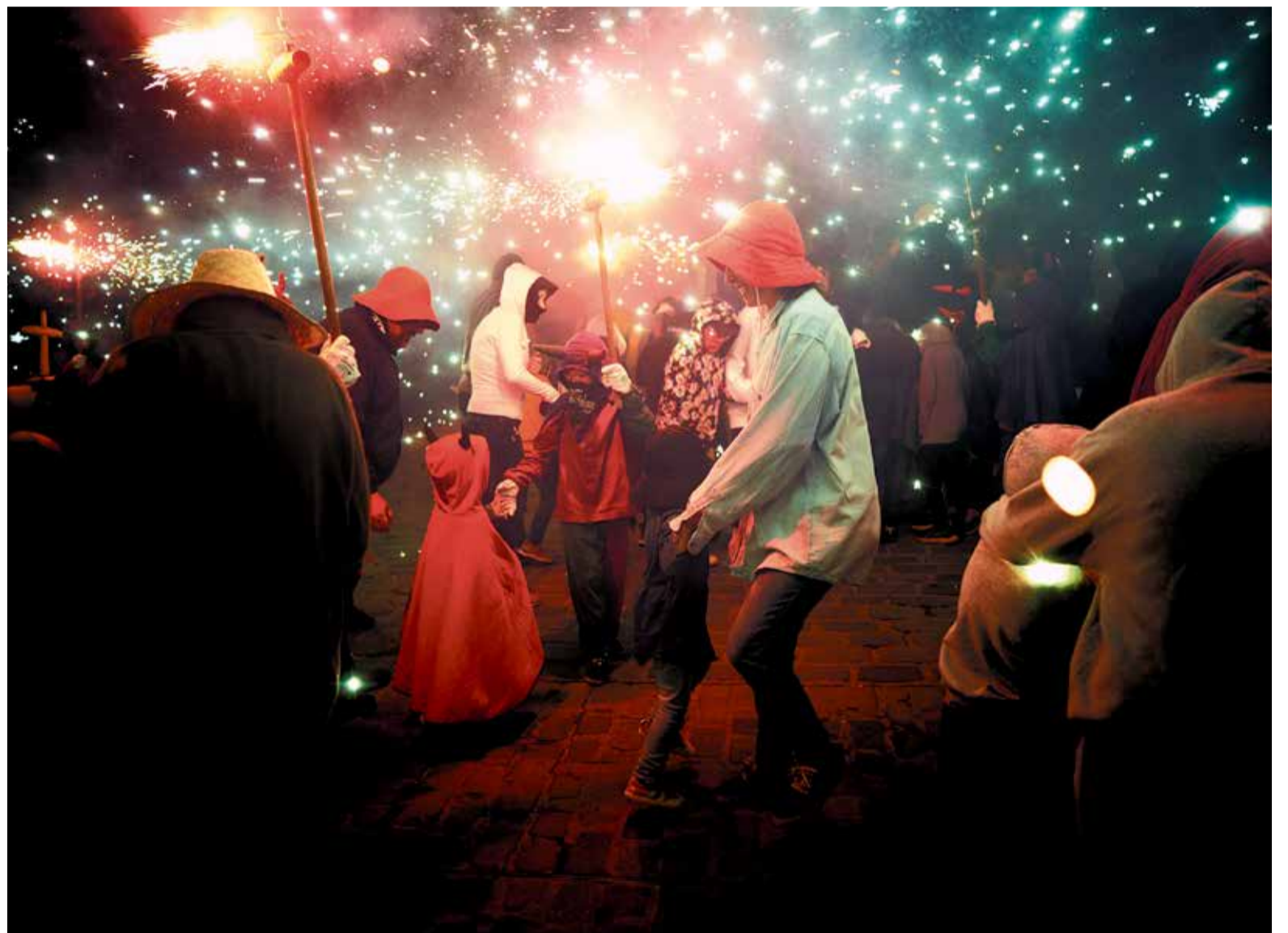
L'any del 30è aniversari de l'Escaldàrium, l'espectacle de foc i aigua adreçat a infants i joves es consolida com a un dels plats forts del programa d'activitats.

Amb motiu del 30è aniversari de la Festa del Foc i de l'Aigua, les no-