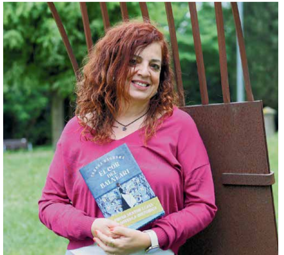
L'escriptora amb un exemplar de la seva última novel·la.

M'interessava perquè per les dones és un moment també molt transcendent, la novel·la comença en acabar la vaga de la Canadenca. És un moment sindical i social de revolta molt important i de reivindicació en què les dones estan demanant el vot femení. És un moment per al feminisme també molt important. El personatge de la Lola, que arriba molt petita a Caldes experimenta tot aquest creixement que una mica és el canvi d'època. El canvi que està experimentant la societat en general, també és el canvi que va fent la Lola també d'alguna manera.