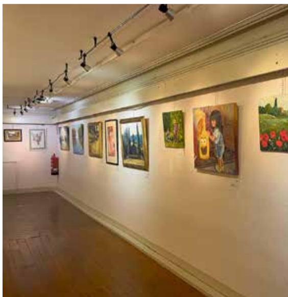
Fotografia del dia d'inauguració, el 4 de juliol.

Al llarg dels anys, La Canaleta ha anat creixent arran de l'adhesió de nous amants de les arts plàstiques, amb diferents referents i interessos pel que fa a les tècniques i estils: des del grafit al carbó, llapis de colors, pastels, aquarel·les, tintes, acrílic i oli.