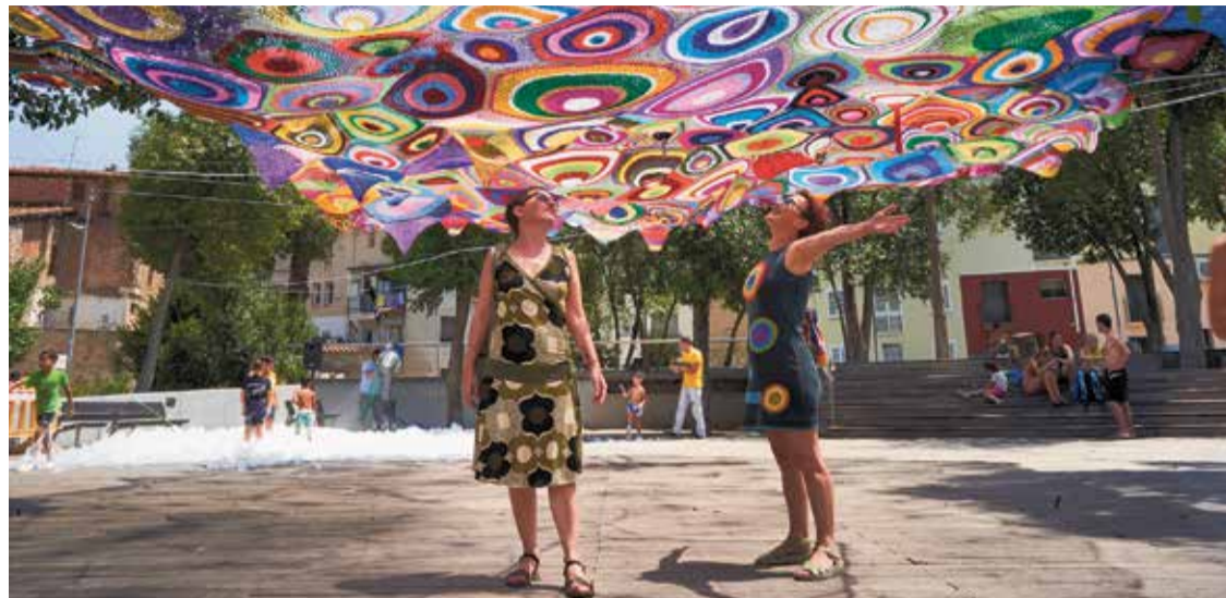
La plaça Onze de Setembre tornarà a lluir engalanada en la festa del Centre Històric, el 20 de juliol. > Q. PASCUAL