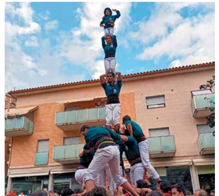
El 3d7 durant la històrica diada de La Bolera, de dissabte passat.

Dissabte 6 de juliol, en el marc dels actes de celebració de la festa del barri de La Bolera, els Escaldats van viure una de les cites més importants del seu calendari, sent la diada que culmina el primer tram de la temporada a casa. Acompanyats dels seus fillols, els Castellers de Castellar del Vallès, i dels Margeners de Guissona, els de Caldes van plantejar-se els reptes més majúsculs assolits fins ara a la plaça, significat la seva segona millor diada en els 27 anys d'història de la colla.