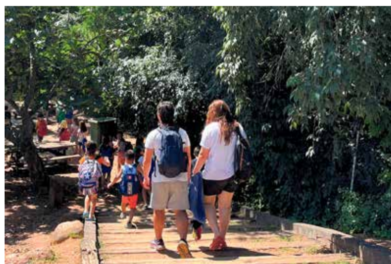
Un grup d'infants en una de les sortides, en el primer dia de casal.

Fins al 26 de juliol, 300 infants i joves de Caldes gaudiran de la proposta d'estiu municipal d'activitats del lleure i l'esport, que va començar el passat 25 de juny. En concret, són 250 infants d'I3 a 6è de primària que participen en el Casal Municipal, i una cinquantena de joves de 1r a 4t d'ESO que ho fan des del Club Jove. La proposta, però, se suma a les diverses iniciatives que ofereixen, enguany, moltes de les entitats esportives i del lleure del municipi. En tots ells, infants i joves gaudeixen d'una variada programació d'activitats que permet viure noves experiències i continuar fomentant vincles d'amistat durant aquest període, estès entre les vacances familiars i el nou curs escolar.