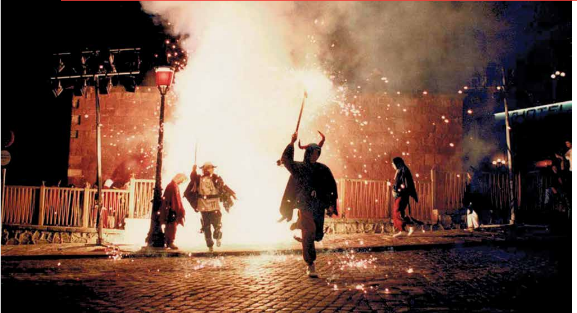
El 1994 va néixer la primera Festa del Foc i de l'Aigua, una festa d'estiu proposada pels Diables, que ja dansaven amb la música de Solé. Un any després, s'hi afegien els 'Amics de l'Aigua'.