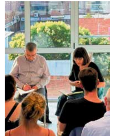
Milà i Boada, durant l'acte.

Un notable grup d'assistents van concentrar-se, el passat dimecres 3 de juliol, a Les Cases dels Mestres, convocats per l'agrupació política local, Comuns Caldes de Montbui. L'acte va iniciar un nou cicle del grup local, inaugurat a partir d'aquesta conferència, titulada 'Transició Ecològica Justa'. La xerrada va ser conduïda pel calderí i representant de l'agrupació en el municipi, Marc Calvo, i va comptar amb l'assistència de Júlia Boada, diputada de Comuns al Congrés dels Diputats i exassessora del Partit Verd Europeu, i Salvador Milà, exconseller de Medi Ambient i Habitatge. Segons l'agrupació local, "era important començar aquest nou cicle posant l'ecologia al centre, ja que en un context de canvi climàtic, sequera i crisi ecosocial és important aportar solucions valentes sense deixar ningú enrere" , van declarar fonts oficials en un comunicat.