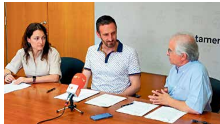
Signatura del conveni amb representants del consistori i l'entitat.

L'Ajuntament de Caldes de Montbui i l'entitat local Caldes Solidària han signat un nou acord de col·laboració per al desenvolupament de programes i activitats de cooperació, solidaritat i cultura de la pau en el municipi. En concret, es tracta d'una dotació econòmica de 5.000 € anuals a l'entitat, que regula una relació de col·laboració existent des de fa 30 anys. Segons l'Ajuntament, el conveni és motivat a "l'organització i realització de diferents activitats vinculades als espais de debat i reflexió, relacionats amb la Justícia Global, l'Educació per la Pau i els Drets Humans" , defensen fonts oficials de l'Ajuntament de Caldes.