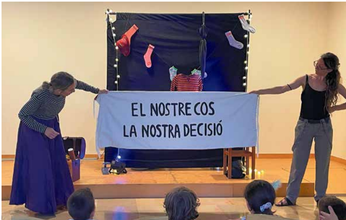
Les dues actrius de Trama SCCL, durant la representació teatral que va acollir la Biblioteca Municipal.

La Trama SCCL va conduir la representació adaptada a infants del conte 'L'armari de l'Òliver' amb motiu del Dia de l'Orgull LGTBIQ+