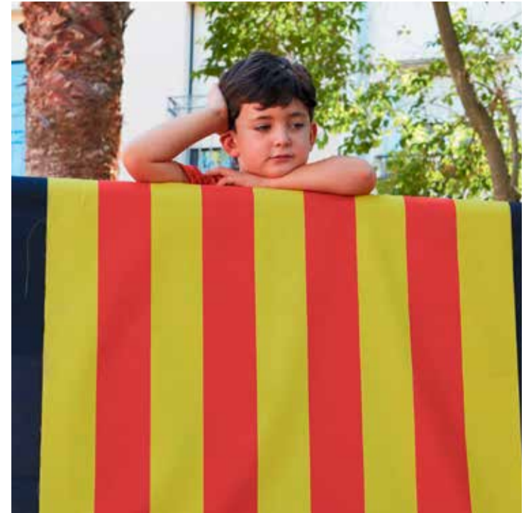
limatge d'arxiu amb la senyera com a protagonista de l'11 S.

Com cada any, Caldes es prepara per commemorar la Diada Nacional de Catalunya a la seva plaça emblemàtica, l'Onze de setembre. La celebració, que tindrà lloc el mateix 11 de setembre, començarà puntualment a les 11 del matí i comptarà amb la participació dels Castellers de Caldes, les corals locals i altres entitats locals.