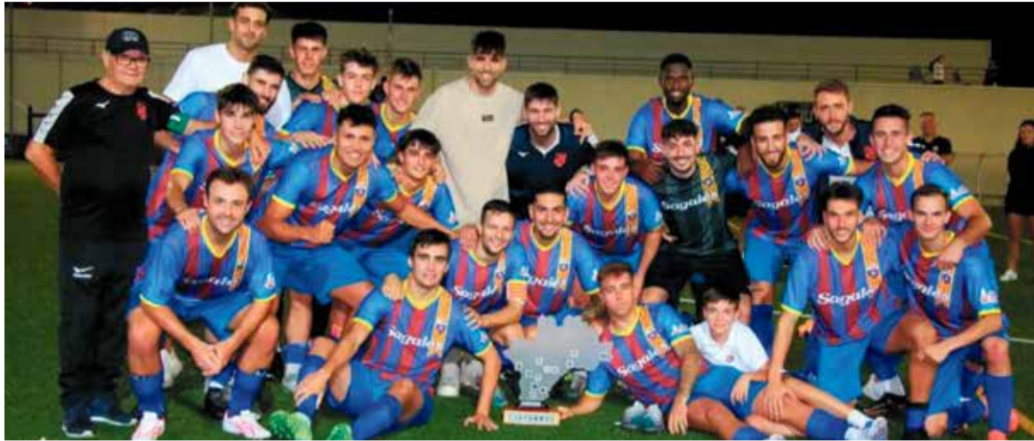
Els jugadors del C. F. Caldes amb el tercer trofeu aconseguit del 12è torneig d'Històrics del Vallès Oriental. &gt; T. GUTI