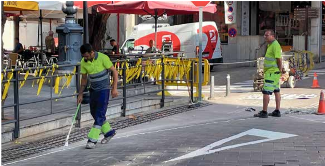
Operaris realitzant els treballs de senyalització de la nova regulació a l'encreuament.