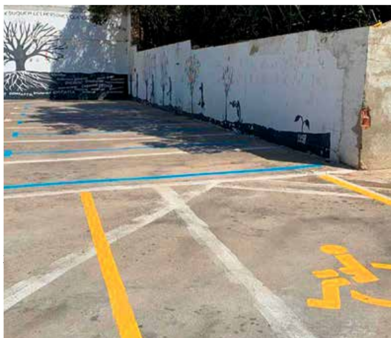
Modificació de zona blava a l'aparcament de l'Escorxador. > CEDIDA

Aquest passat 1 de setembre van entrar en vigor dues modificacions pel que fa a zones d'aparcament del municipi. D'una banda, s'han suprimit 11 places de la zona blava de l'avinguda Josep Fontcuberta (concretament, 7 en el tram comprès entre els carrers de l'Estació i de Pau Cuscó i 4 en el tram comprès entre els carrers de Francesc Macià i de Velázquez) i, d'altra banda, s'han implantat a la part baixa de l'aparcament de l'Escorxador, que fins ara estava regulat amb disc horari. Les tasques de repintat de les places, la modificació de la senyalització vertical i la reubicació del parquímetre s'han dut a terme durant l'agost. Durant els primers 15 dies els agents de mobilitat informaran de la nova regulació i resoldran qualsevol dubte relacionat amb l'aparcament sense imposar sancions.