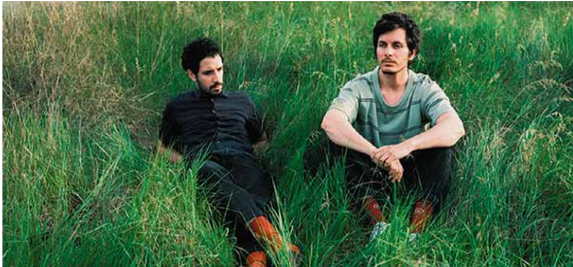
El grup osonenc, Hereu Escampa, visitarà El Centre el pròxim 12 de novembre dins la programació de tardor.

L'escena cultural calderina enceta un nou curs i nova temporada tardor-hivern, amb una àmplia gamma d'esdeveniments