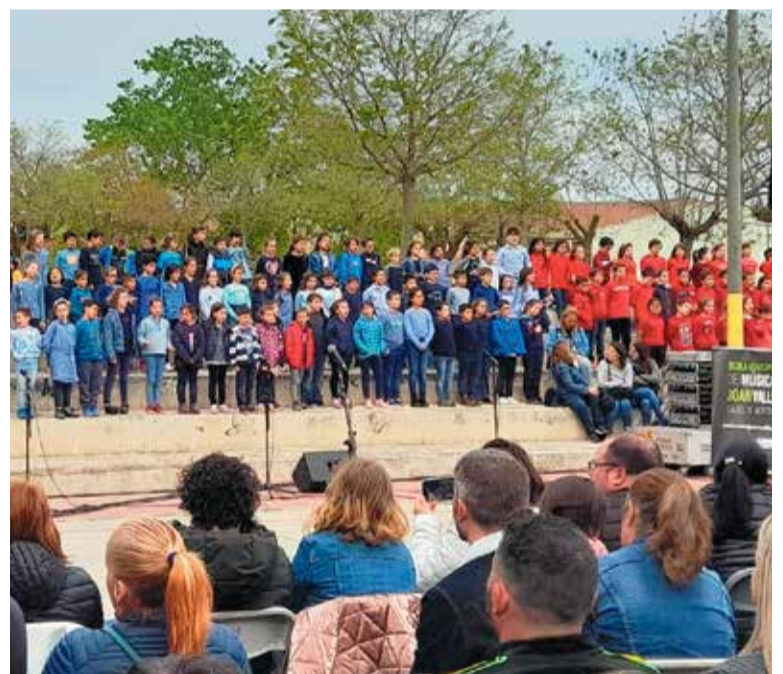
A la part superior classes del taller d'art de ceràmica. Imatge inferior, cantata al parc del Bugarai “La rebel·lió a la cuina” amb la participació dels infants de 2n de primària de les 4 escoles del municipi i l'acompanyament instrumental dels alumnes de l'EMM.

ESCOLA MUNICIPAL DE MÚSICA JOAN VALLS CALDES DE MONTBUI