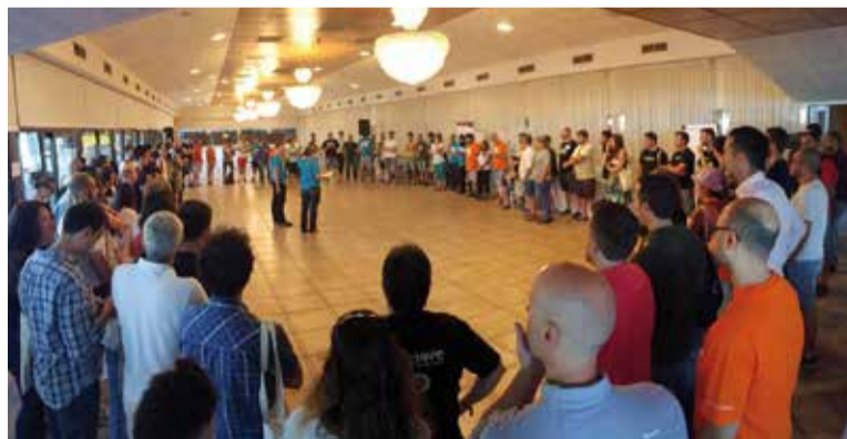
L'inici de la jornada viscuda divendres passat.&gt; @agileopenspain

L'objectiu de l'Agile Open Spain és el de "promoure i compartir bones pràctiques en el desenvolupament de software, tant a nivell tècnic com de gestió, i generar noves