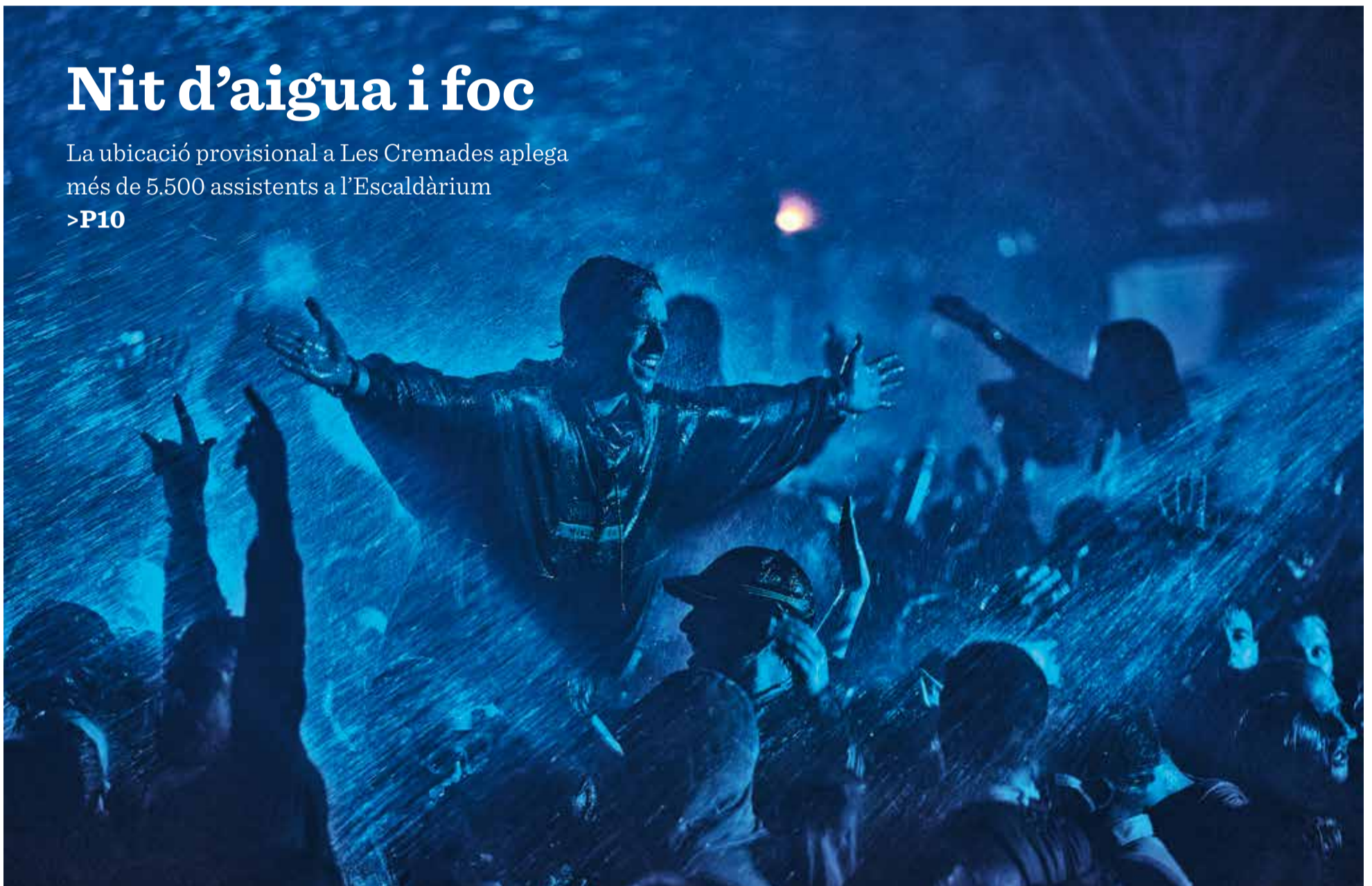
Moment de disbauxa durant una de les tres tempestes d'aigua que s'intercalen amb les sis danses de foc de què consta l'Escaldàrium. > J. SERRA

La ubicació provisional a Les Cremades aplega més de 5.500 assistents a l'Escaldàrium >P10