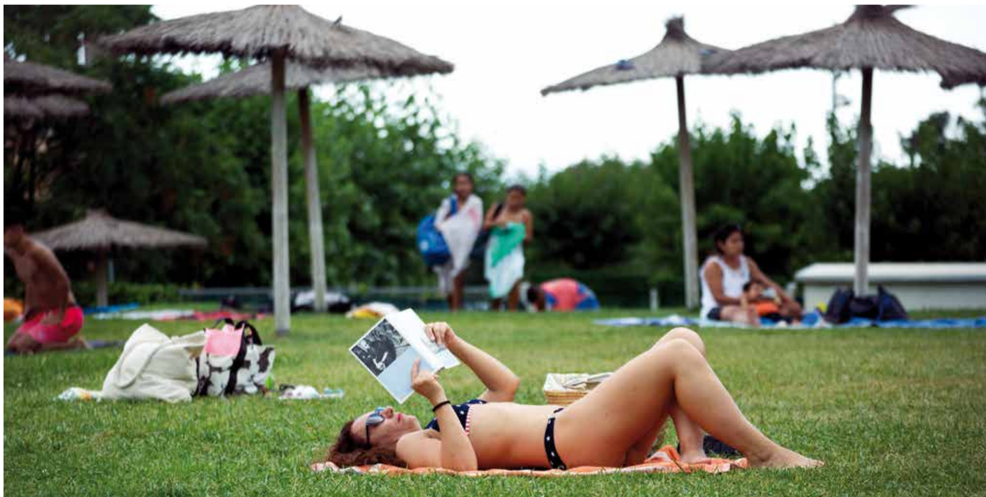
Una usuària del CN Caldes gaudint de la lectura vora la piscina exterior del complex esportiu Les Cremades.

L'arribada del gran mes de les vacances fa que no hi hagi molta activitat al carrer però sempre hi ha plans alternatius