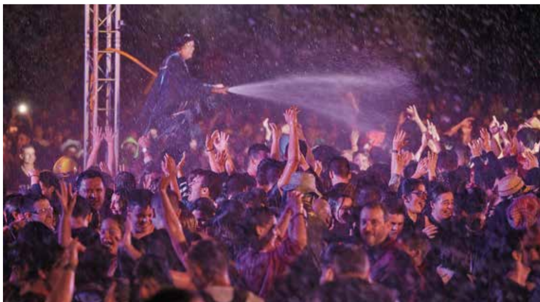
Participants a la dansa de la invocació al pas del pal·li i una de les tempestes d'aigua de l'Escaldàrium.

més reivindicatiu i feminista que en les altres edicions. Es va habilitar un punt lila amb la campanya No és no, a Caldes festes lliures de sexisme; l'avantsala d'un protocol contra agressions sexistes de l'Ajuntament i Caldes Feminista. L'objectiu era posicionar Caldes de Montbui contra tot tipus de coaccions i agressions de gènere, fet que es va dur a terme amb èxit, ja que el punt lila només va atendre algunes incidències lleus.