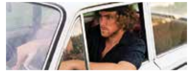
PAU BLANC · 20/7 · 21 H