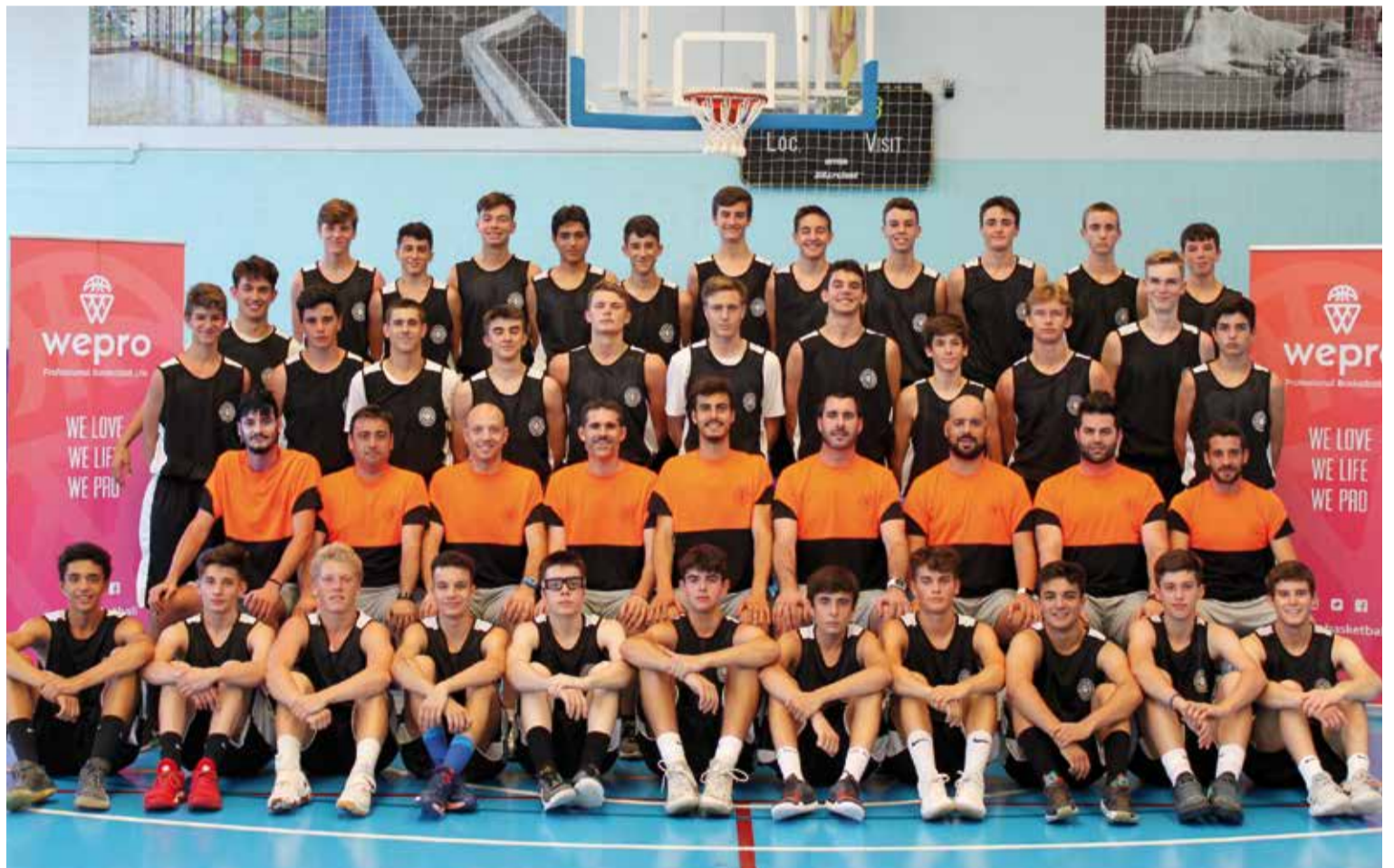
Foto de família de jugadors i cos tècnic de l'Internacional WePro Basketball posant al pavelló Municipal Les Cremades durant l'stage.

L' stage d'estiu de WePro Basketball s'estableix a la Vila per formar jugadors per a l'elit