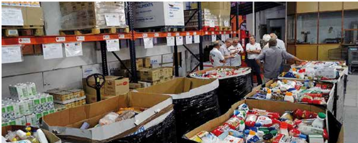
La segona campanya de recollida d'aliments de l'any ha tingut lloc els dies 6 i 7 de juliol. &gt; AJUNTAMENT DE CALDES