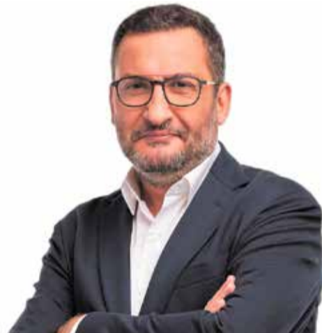
El periodista Toni Soler visitarà Caldes.

"Si deixem de banda el turisme, la cuina i l'hoquei sobre patins, Catalunya no és una potència mundial. Això, no cal dir-ho, és una gran injustícia, però per sort tenim excuses per triar i remenar". El periodista, productor de televisió i director de la revista El món d'ahir, Toni Soler, protagonitza la xerrada Per què Catalunya no és una potència mundial? , i arriba a Caldes de Montbui el pròxim divendres 13 de setembre, a les 19 hores, al Teatre del Centre. Amb més humor que rigor, Soler explicarà els entrebancs que ha patit el territori al llarg de la història i com, malgrat tot, Catalunya continua existint i fent-se notar. L'acte, organitzat per l'UPCM i el Centre, és un projecte de la Federació d'Ateneus de Catalunya.