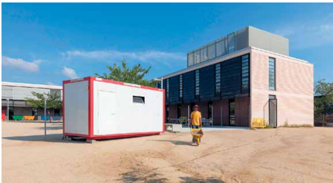
Les obres conviuran amb l'activitat lectiva del centre educatiu, amb previsió d'un any de duració. > J. SERRA

d'acabar l'edificació en un any i estrenar l'equipament el curs vinent