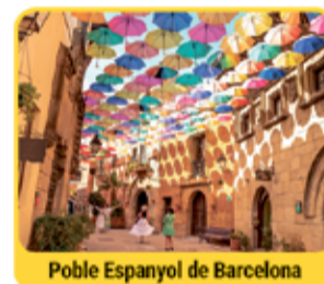
Poble Espanyol de Barcelona

A la falda de Montjuïc trobem el Poble Espanyol , punt d'interès artesanal on es poden veure diàriament a professionals de diferents disciplines i generacions que mostren el valor del treball manual i ofereixen la possibilitat de fer tallers ràpids i personalitzats, cursos i venda de producte . Passeja pels seus carrers, els quals emulen l'arquitectura de diferents zones del territori i gaudeix d'una experiència única a la ciutat de Barcelona . Més informació: www.poble-espanyol.com