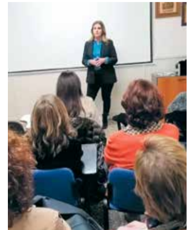
Conferència del cus anterior.

L'UPCM presenta la programació del nou trimestre del curs