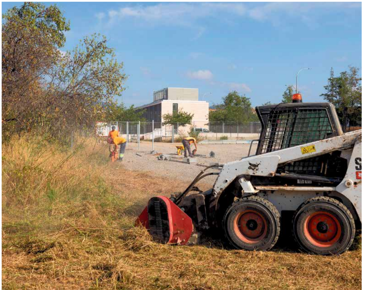
Operaris en els primers treballs d'arrencada del projecte de construcció del nou edifici que ocuparà l'Institut Escola de Caldes de Montbui.