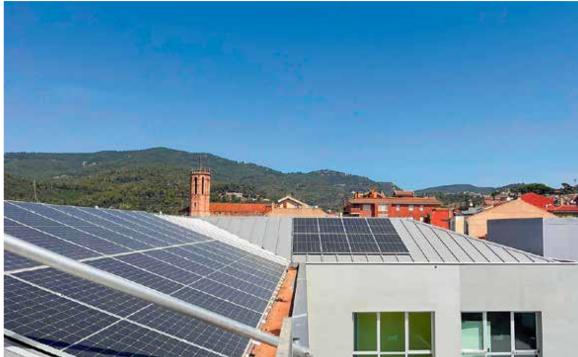
Exemple d'una de les darreres instal·lacions públiques, en aquest cas, a la coberta de Les Cases dels Metres.

En compliment del Pla d'Acció Climàtica -que integra l'estratègia de desplegament de la CEL de Caldes- "l'Ajuntament continua treballant en la sostenibilitat i en l'estalvi econòmic" afegeix el regidor, mentre posa l'accent en l'assoliment d'unes xifres "que no tenen comparació amb cap altre municipi de l'en-