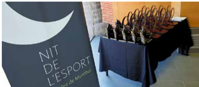
Guardons de la 8a edició de la gala, que va celebrar-se l'any 2022.

La vila es prepara per a celebrar la 9a edició de l'esdeveniment i posa en marxa la votació popular al Guardó Especial, fins al 8 de setembre