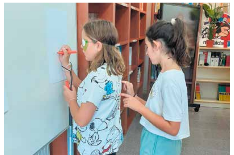
Alumnes de cycle superior en el marc de la jornada del curs passat.

sitat de les persones i destacar les habilitats i capacitats que tots i totes posseïm: "El nostre centre és SIEI (Suport intensiu per a l'Escolarització Inclusiva) i considerem important conèixer i atendre la diferència a partir de les capacitats de tothom, i si alguna persona no pot fer alguna cosa cal demanar ajuda al grup" continua García, tot remarquant que, "a partir d'aquesta idea, perseguim transformar el pati de l'escola en un espai de convivència inclusiu, alegre i actiu" .