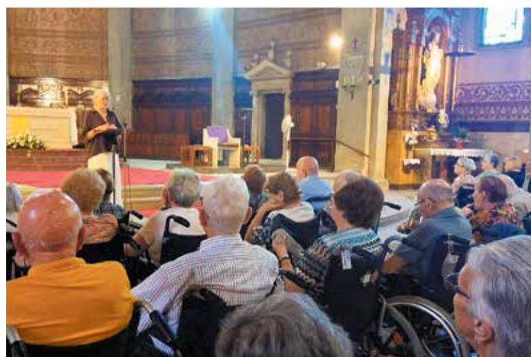
Inici de la celebració amb l'eucaristia a l'Església de Santa Maria.

La diada de Santa Susanna posa el punt final al lema del curs “Cuidant des del cor”, amb el qual la Fundació ha volgut visibilitzar la vocació i la dedicació de les persones treballadores, l'entrega i l'amor de les famílies de les persones ateses, i el compromís i l'ajuda del voluntariat.