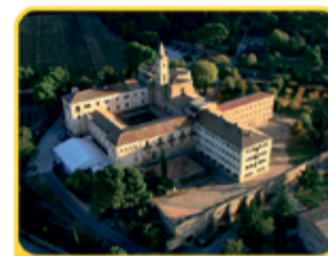
Monestir de les Avellanes

El Monestir de les Avellanes és una antiga abadia fundada al segle XII , situada al bell mig d'un entorn natural de boscos i vinyes, ideal per gaudir de la tranquil·litat i descobrir els secrets del Montsec . Aquest indret ofereix estades a l' Hostatgeria del Monestir , experiències astronòmiques visitant el Centre d'Observació de l'Univers o endinsar-te al món del vi i les vinyes amb la visita d'un celler dins la Ruta del Vi de Lleida. Visita'ls!